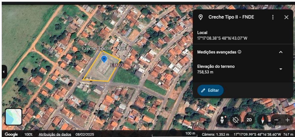
Google Earth-24/04/2026 – CRECHE TIPO II.

Ressalta-se, ademais, que, além das demandas já identificadas, poderão surgir novos programas de implantação de equipamentos públicos, bem como obras a serem executadas com recursos próprios do Município, ampliando a necessidade de investigações geotécnicas em diferentes áreas. Nesse contexto, os serviços de sondagem a percussão (SPT) e de ensaio de percolação mostram-se imprescindíveis para a adequada caracterização do subsolo, fornecendo parâmetros técnicos essenciais ao correto dimensionamento de fundações e demais elementos estruturais das edificações, garantindo a segurança, a economicidade e a durabilidade das obras a serem implantadas no território municipal.