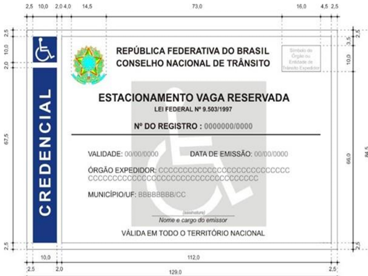
1.3 Verso da Credencial em formato físico