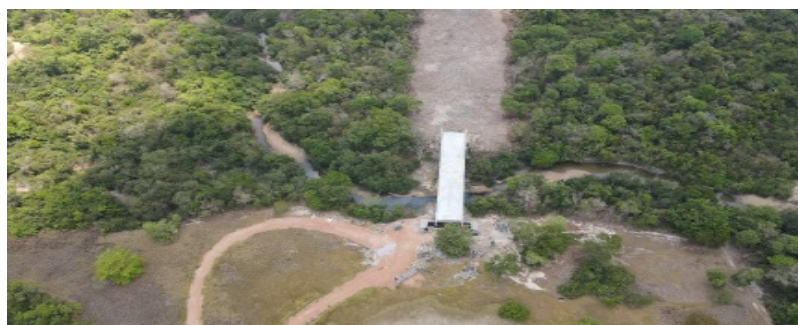
Imagem 02 - Imagem aérea da área de implantação da obra.

1.3. Dados do Processo: [SEI nº 202500005043632 ].