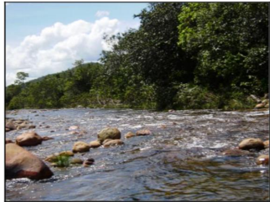
Figura 3: O Rio Corrente e seu leito rochoso. Autoria: M.G de Almeida, abril 2009.