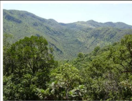
Figura 2: Relevo acidentado e vegetação de cerrado Autoria: M.G de Almeida, abril 2009.