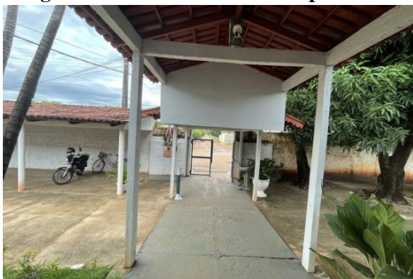
Fotografia 01e 02 – Entrada Principal

Segue abaixo imagens do levantamento fotográfico: