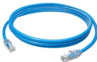
Imagem 09: Patch Cord