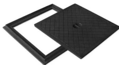
Figura 12: Caixa tipo R-1.

A caixa tipo R-1 pré-moldada deverá ser fabricada conforme os requisitos estipulados pela NBR-9062: Projeto e execução de estruturas de concreto pré-moldado e NBR-16085: Poços de visita e inspeção pré-moldados em concreto armado para sistemas enterrados – Requisitos e métodos de ensaio . Essas caixas são destinadas à instalação em calçadas, jardins, praças, entre outros locais, onde não há tráfego de veículos. No fundo da caixa tipo R-1 pré-moldada, deve-se deixar uma abertura com diâmetro de 30 cm para permitir a drenagem da água que possa infiltrar na base.