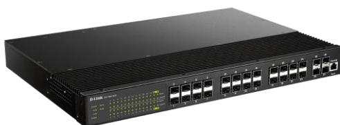
Figura 4: Switch gerenciável