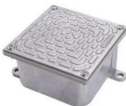
Figura 11 – Caixa de passagem de piso

Caixa de passagem fabricada em alumínio, com tampa reversível (lisa e antiderrapante), fixadas com parafusos com tratamento especial e junta de vedação, grau de proteção IP-65. Aplicada na montagem de equipamentos elétricos em geral e outras ligações em ambientes úmidos e com emanção de gases não inflamáveis, utilizada para instalações industriais e com tampa lisa para pátios, ruas, calçadas, etc.