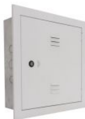
Figura 6: Distribuidor Geral de Telefonia - DGT

ocorrerá a conexão do cabo da concessionária com a rede do edifício. Deverá ter número de canais compatíveis com os pontos de telefonia que serão previstos no projeto executivo.