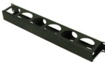
Figura 2: Guia de Cabos