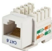
Figura 10: Conector fêmea CAT6