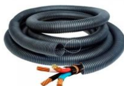
Figura 13 – Eletroduto Kanaflex PEAD.

ABNT NBR-14692: Sistemas de dutos, subdutos e microdutos para telecomunicações - Determinação do tempo de oxidação induzida;