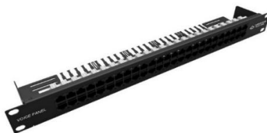
Figura 5: Voice Panel