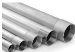
Figura 14 – Eletroduto Rígido.

Eletroduto rígido de aço carbono, galvanizado eletroliticamente, rosqueável, com uma luva em barras de 1,5 metro e protetor de rosca, fornecido em barras de 3,0 metros. O eletroduto de aço é um componente essencial em instalações elétricas, oferecendo proteção aos cabos condutores. Fabricado em aço galvanizado, o eletroduto apresenta resistência à corrosão e durabilidade, garantindo uma longa vida útil. Sua principal função é abrigar e proteger os fios elétricos contra danos mecânicos e interferências externas, assegurando a segurança e a integridade do sistema elétrico. Além disso, sua versatilidade permite a passagem de cabos em diferentes ambientes, proporcionando uma solução eficiente e confiável para condução elétrica em variadas aplicações. Atende aos requisitos da NBR-13057: Eletroduto rígido de aço-carbono, com costura, zincado eletroliticamente e com rosca ABNT NBR 8133 - Requisitos.