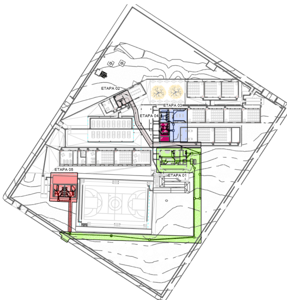
Etapas de execução (Esgoto Sanitário) do CEPI José Feliciano Ferreira

A reforma e ampliação do projeto CEPI José Feliciano Ferreira, será realizada em três etapas, organizadas da seguinte maneira: