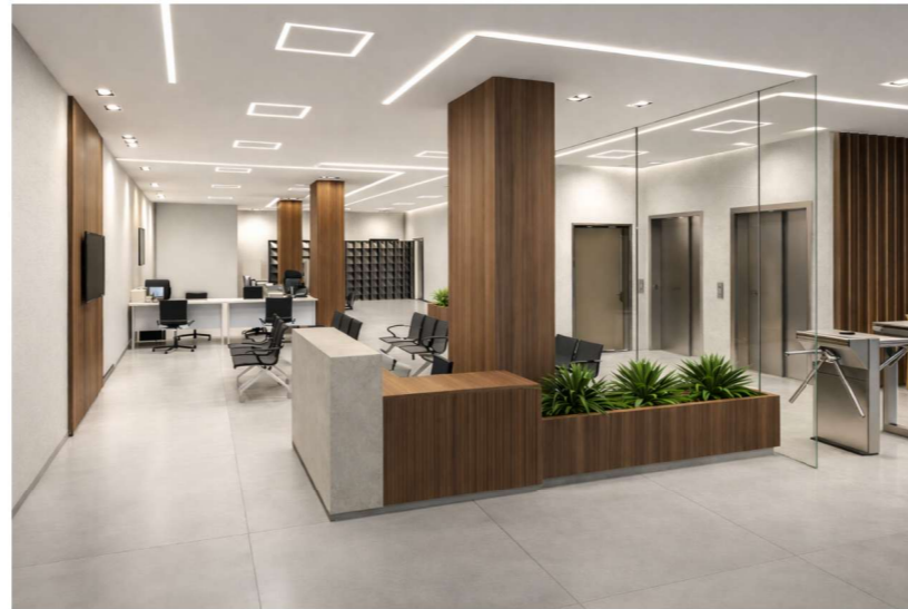
VISTA RECEPÇÃO 1