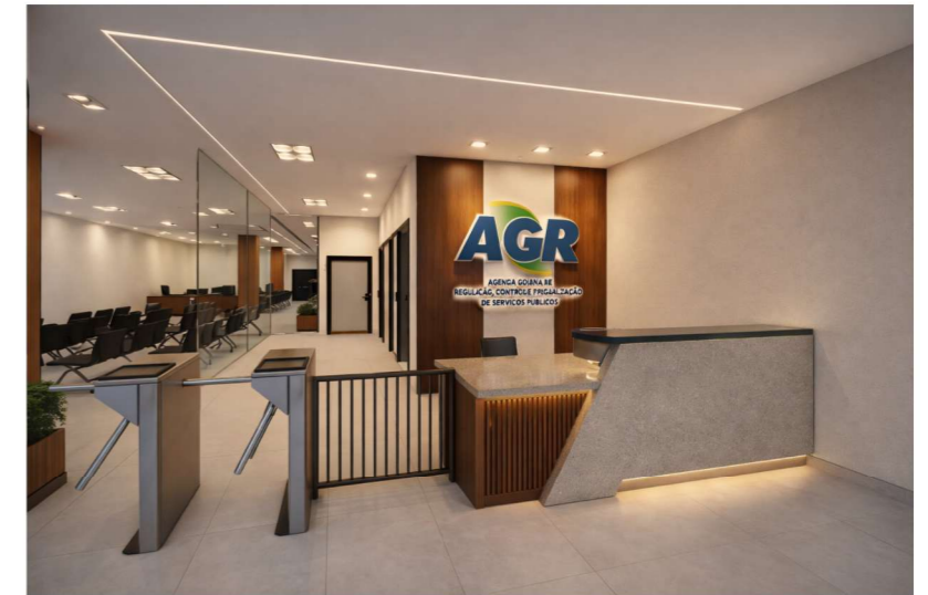
VISTA RECEPÇÃO 2