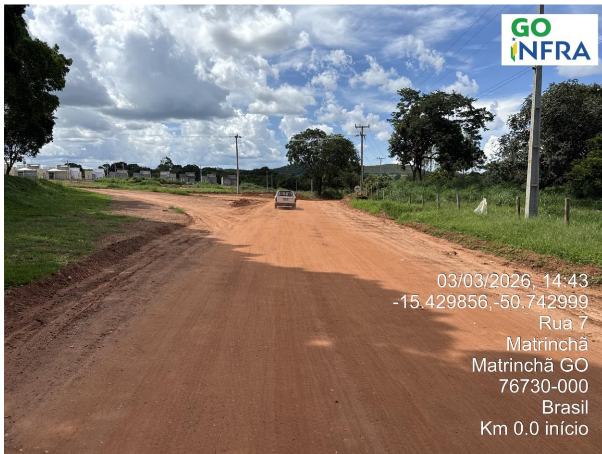
Km 0,0 – Go: 449: Fim do Perímetro Urbano de Matrinchã

A seguir é apresentado em sequência os registros fotográficos com legenda, tendo como foco principal o levantamento dos aspectos encontrados ao longo do trecho.