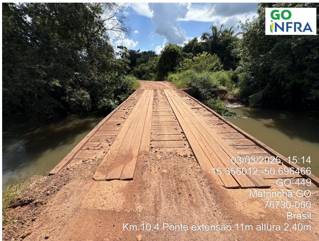
Km 10,40 – Ponte de madeira 11 metros de extensão.