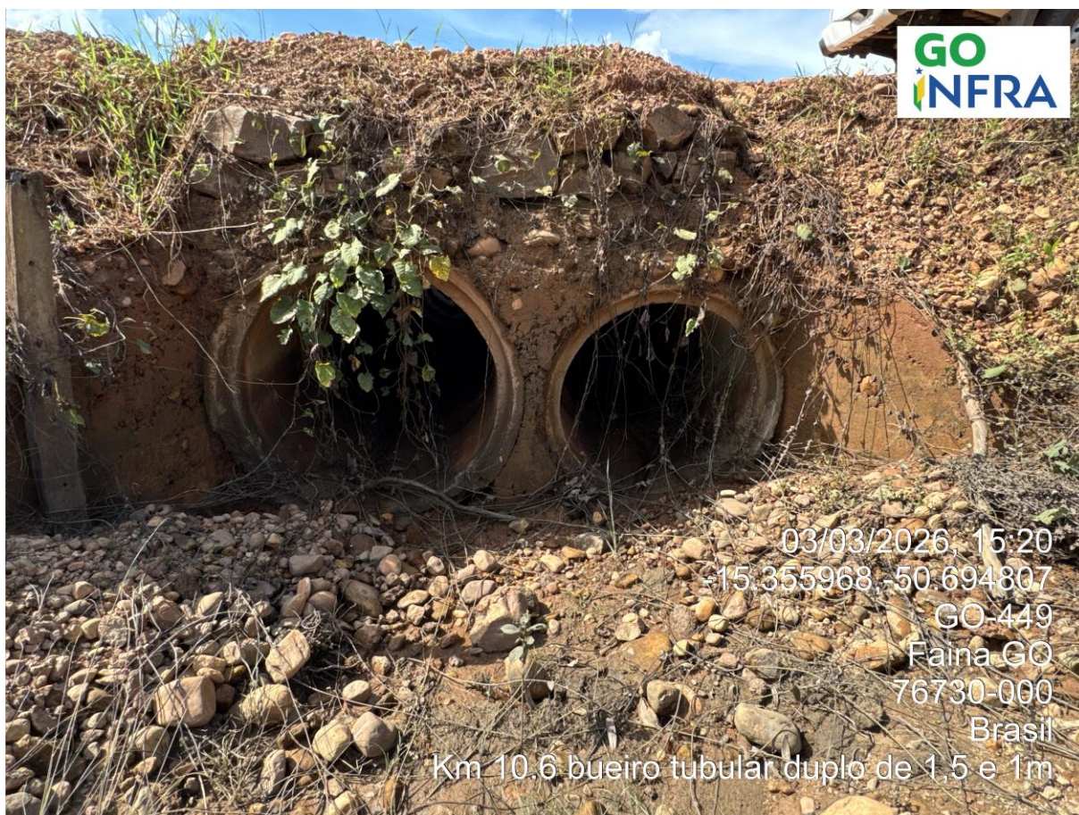
Km 10,6 - Bueiro Tubular Duplo