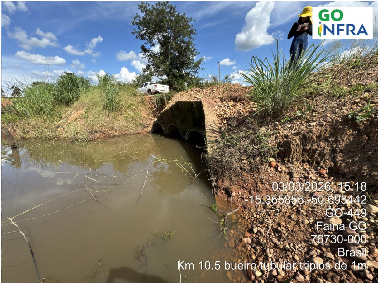
Km 10,5 – Bueiro Tubular Triplo