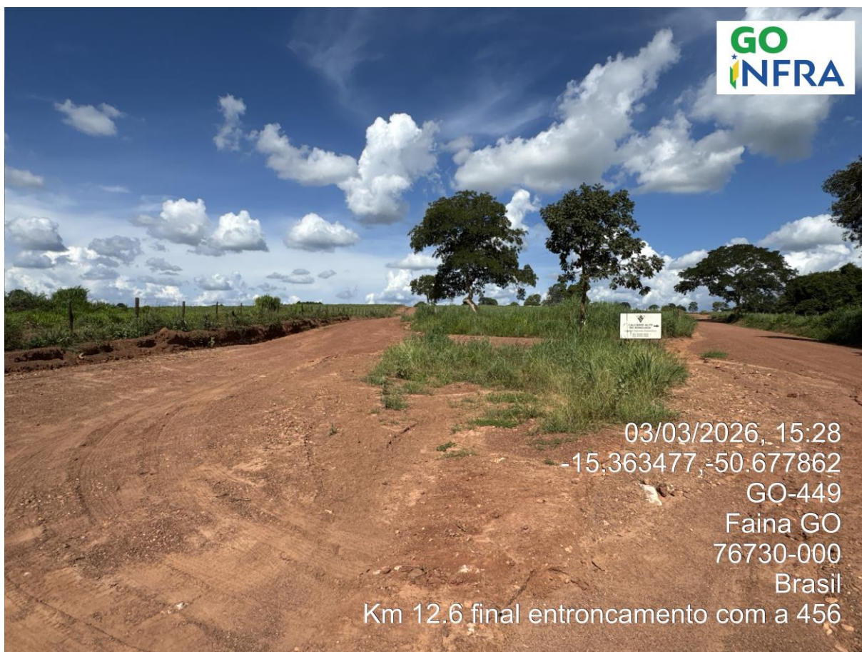
Km 12,60: Fim do trecho – Ent. GO-456