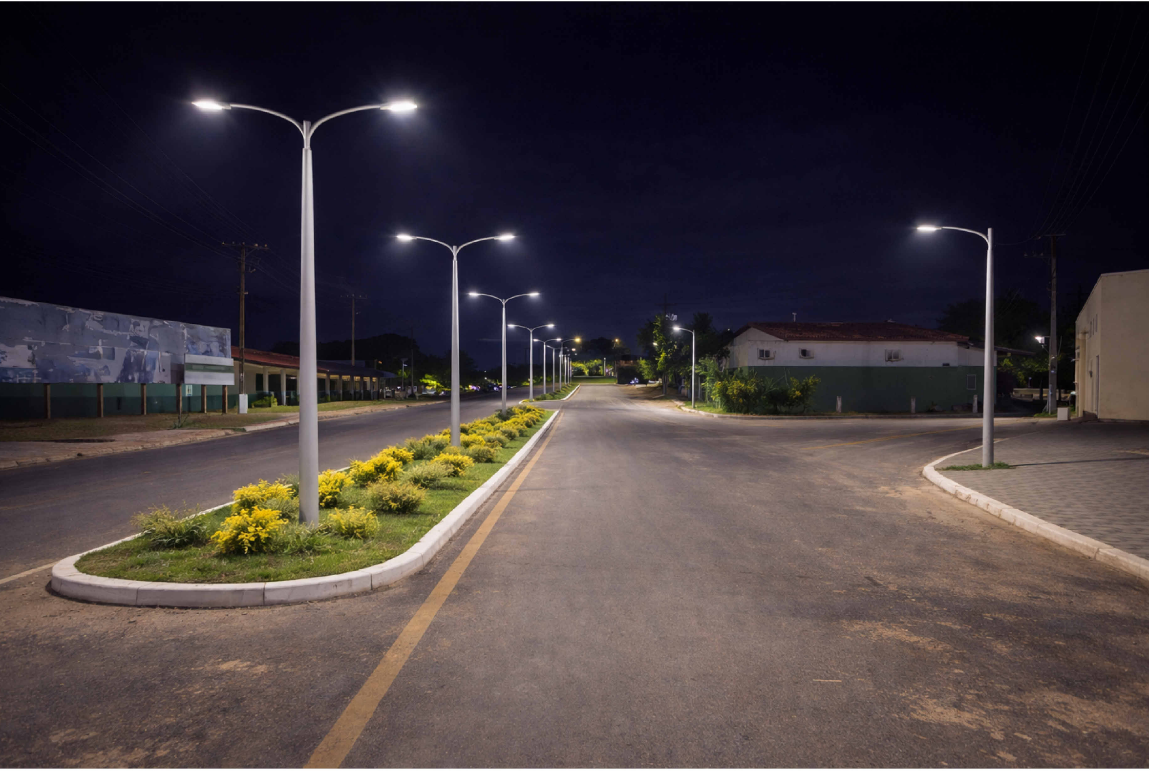
REPRESENTAÇÃO REALISTA - 02 1:25