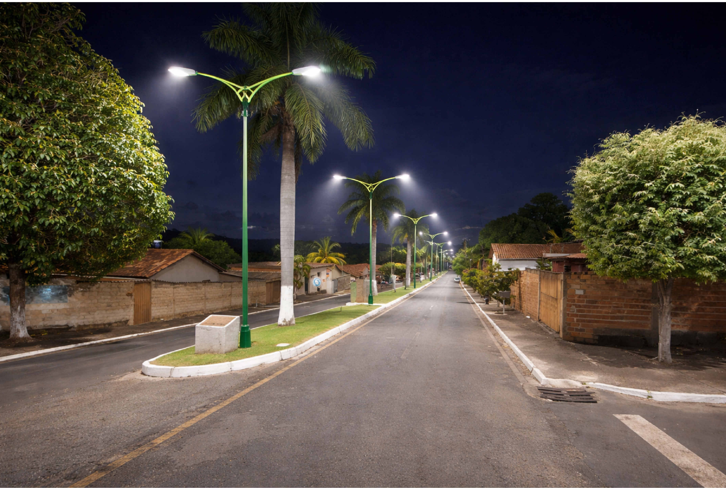
REPRESENTAÇÃO REALISTA - 01 1:25