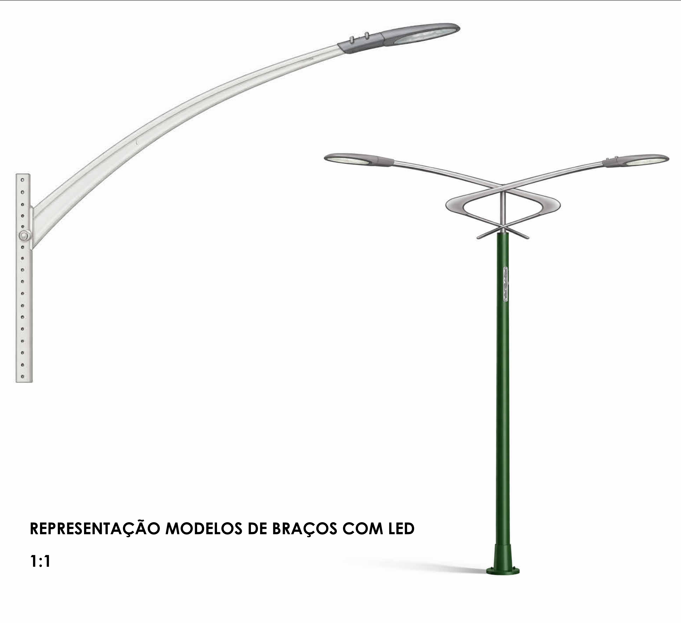
REPRESENTAÇÃO MODELOS DE BRAÇOS COM LED 1:1