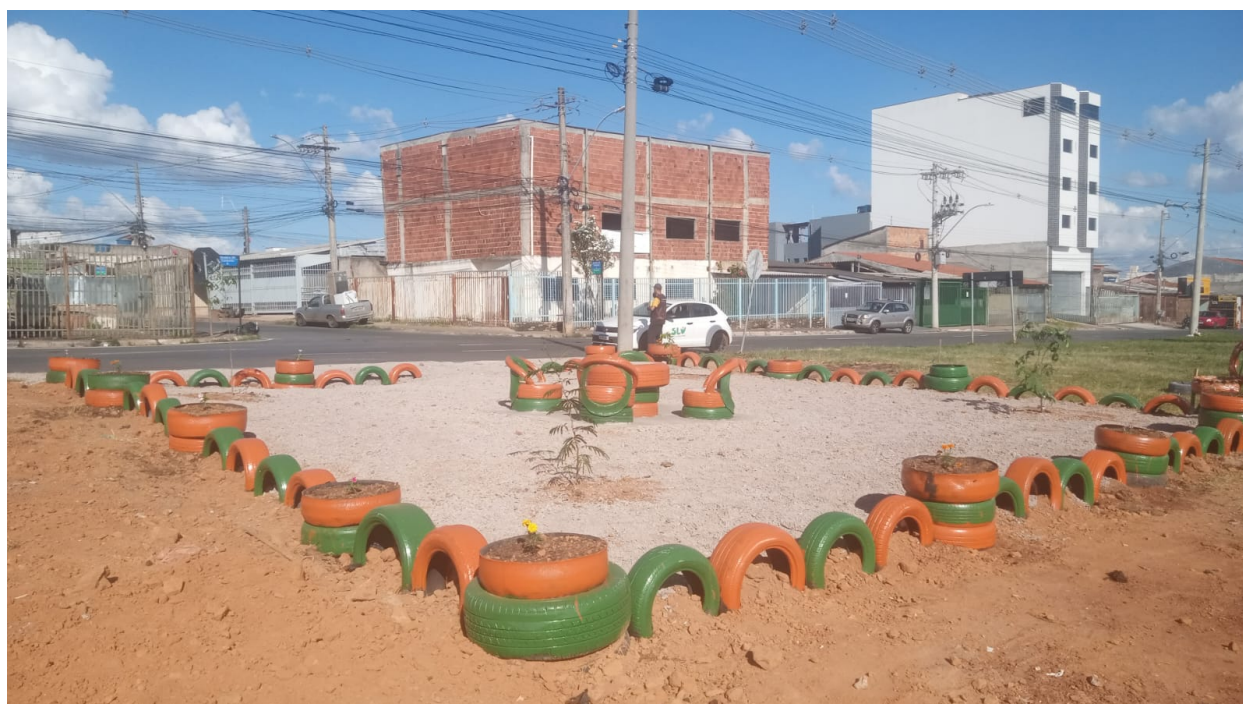
Figura 1: Protótipo Projeto "De Cara Nova"

Tais materiais deverão possibilitar a revitalização dos pontos de descarte irregular no modelo abaixo: