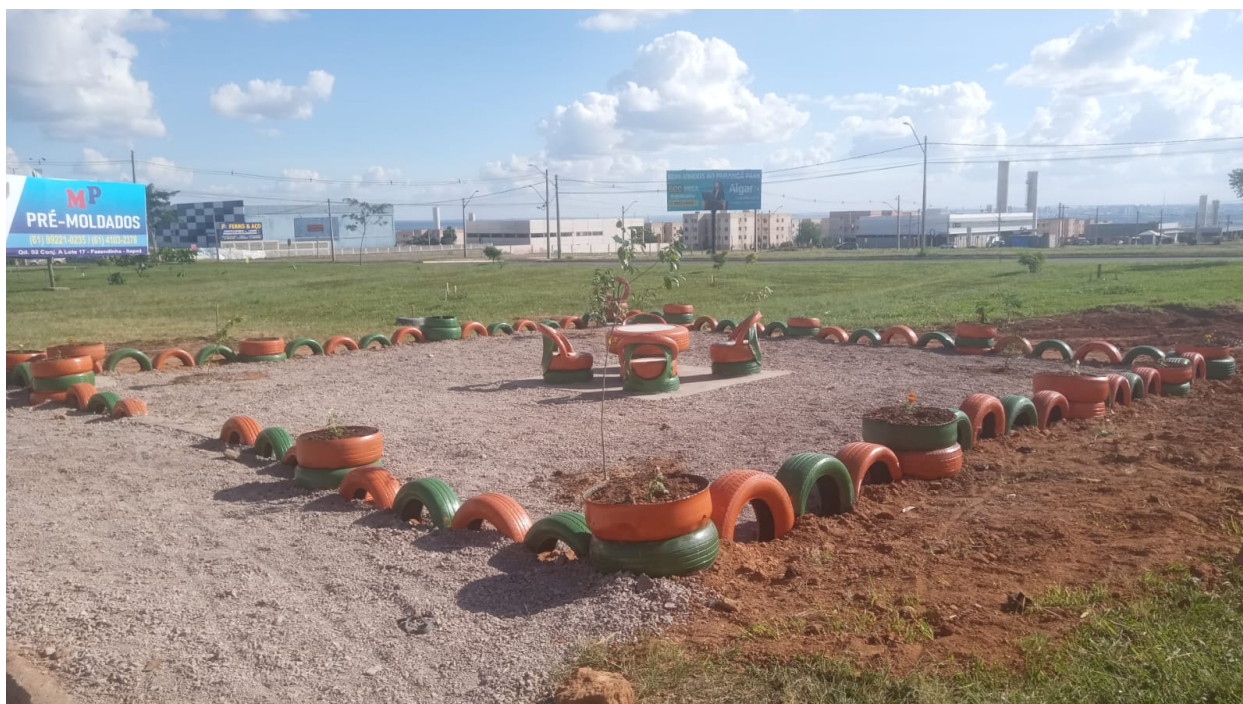
Figura 3: Protótipo Projeto "De Cara Nova"

A partir dessa base, o quantitativo de cada insumo foi dimensionado pela multiplicação do consumo unitário por unidade do Projeto pelo número de unidades estimado (146), conforme memória de cálculo a seguir.