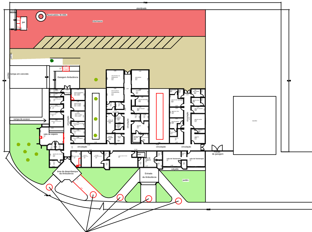
PLANTA BAIXA 1:100