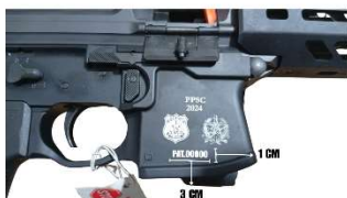
Figura 3- Modelo gravação Brasão e Numero de Patrimônio -Taser 10