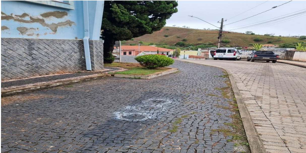
Figura 5 – Vista lateral esquerda