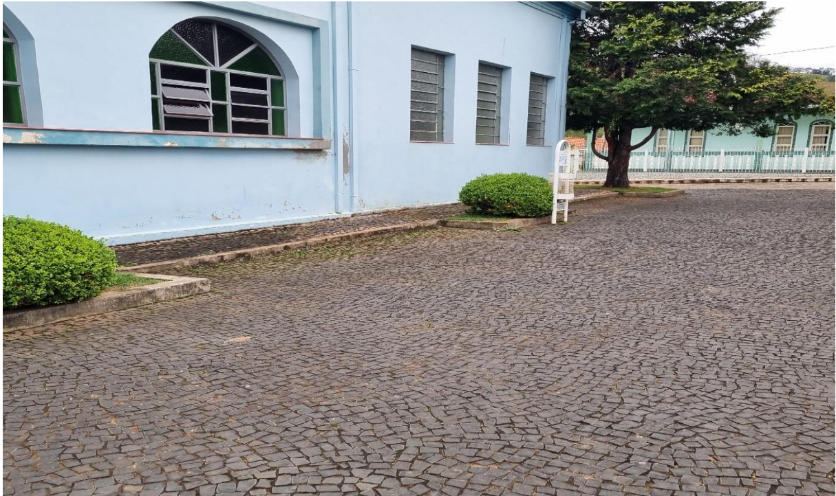
Figura 3 – Vista Lateral direita