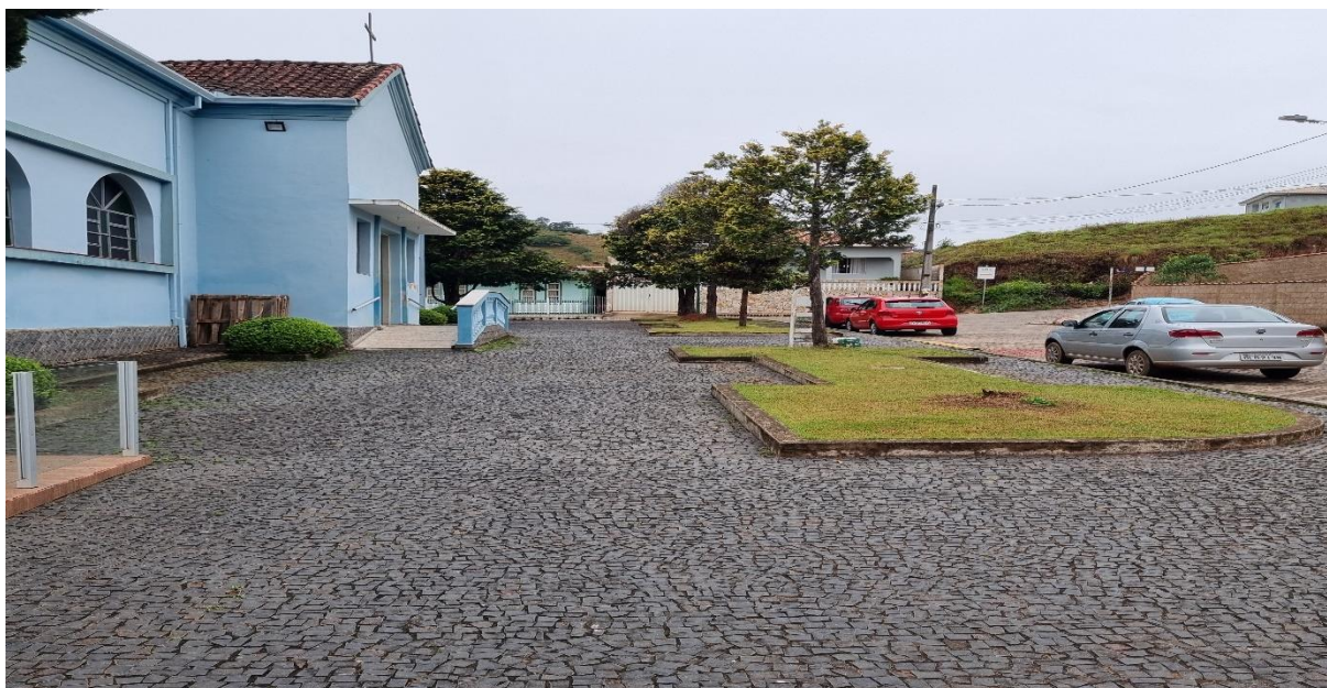
Figura 2 – Vista Lateral direita