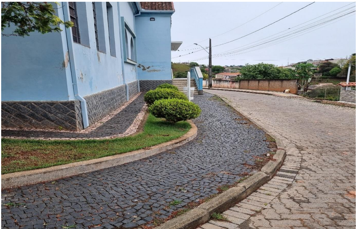
Figura 4 – Vista Lateral esquerda