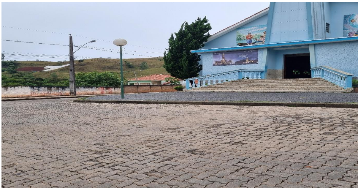
Figura 1 – Vista frontal