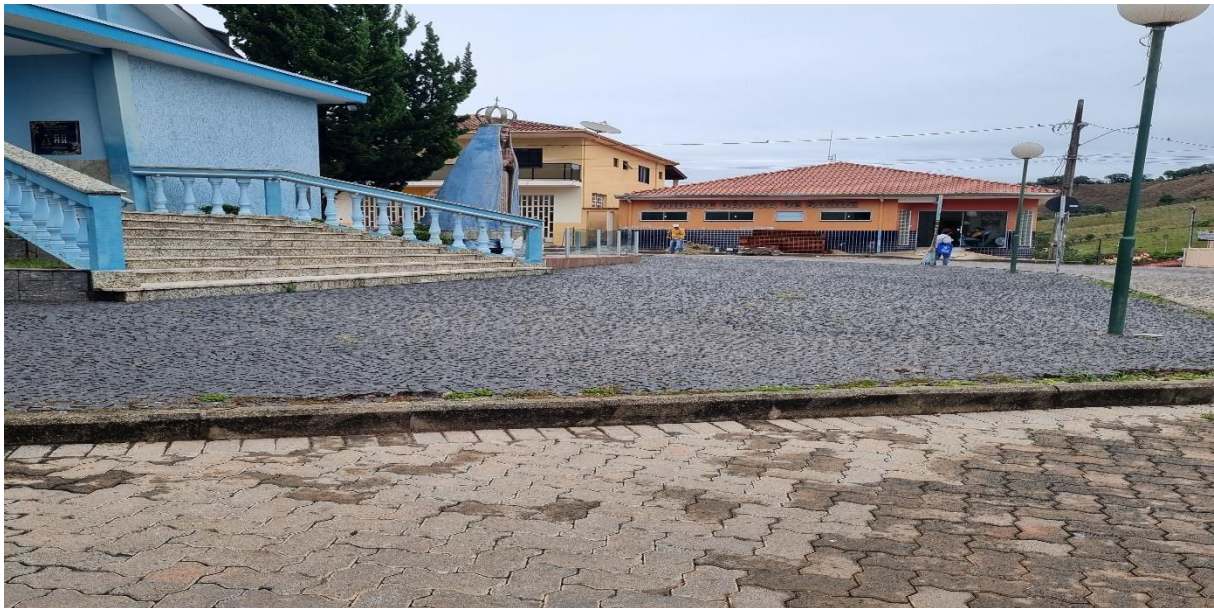
Figura 6 – Vista Geral