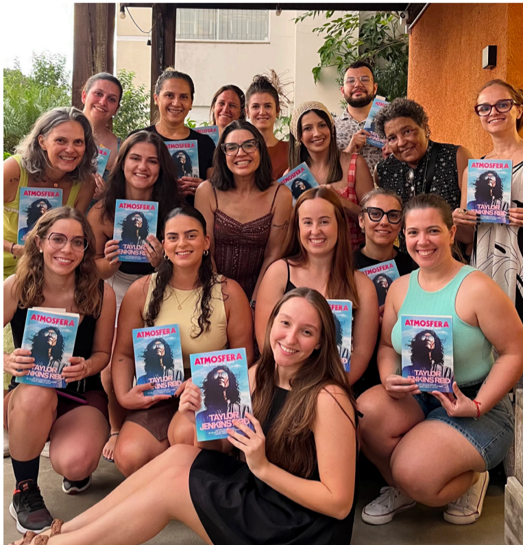
Participantes se reúnem sempre no último domingo do mês para conversar sobre o livro sugerido