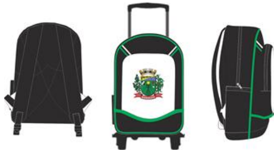
IMAGEM MERAMENTE ILUSTRATIVA (TRASEIRA)

IMAGEM MERAMENTE ILUSTRATIVA (FRONTAL E LATERAL)