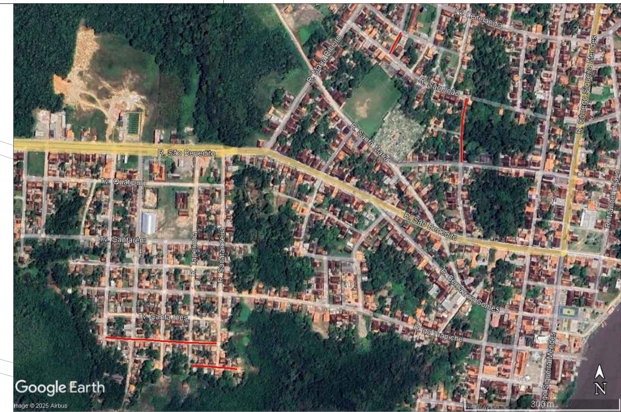
IMAGEM SATÉLITE SEM ESCALA