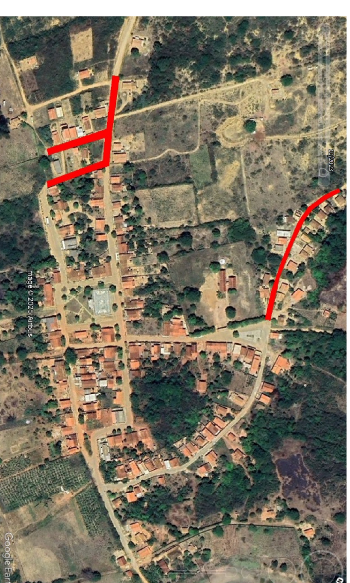
Localização - Vereda do Paraíso