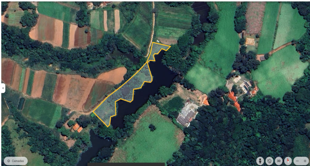
Foto 02: Sítio Pica-Pau Amarelo – Área 2 – Será reflorestada e cercada