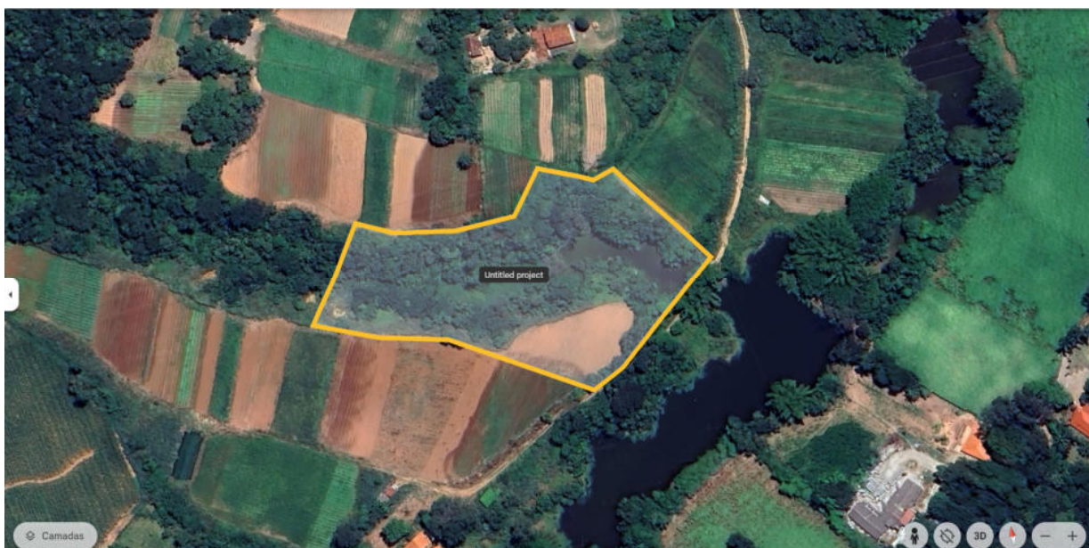
Foto 01: Sítio Pica-Pau Amarelo - Área 1 - Será reflorestada e cercada - Fonte: Google Earth