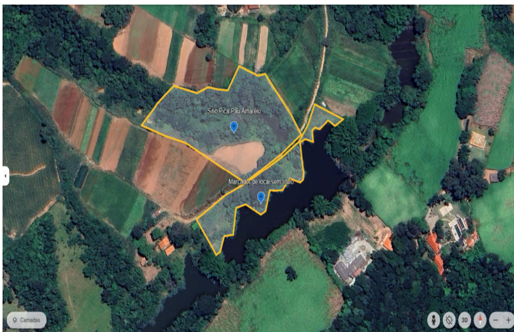
Figura 02: Área para restauração florestal - Fonte: Google Earth.