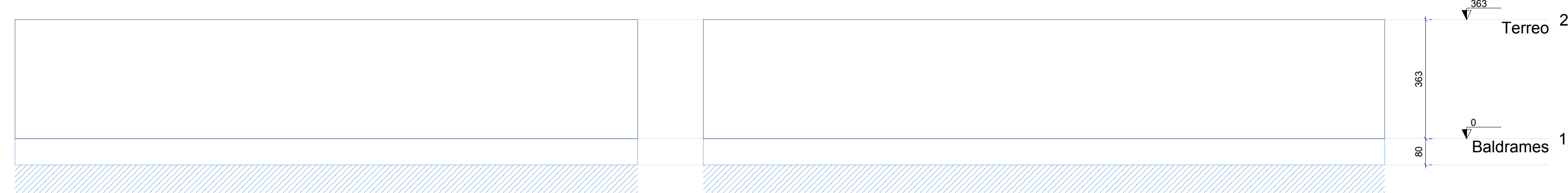
CORTE X-X Escala 1:100