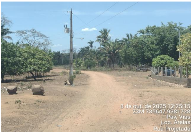
FOTO Nº 09- RUA PROJETADA