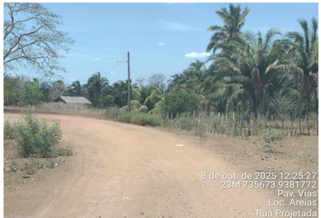
FOTO Nº 10 - RUA PROJETADA