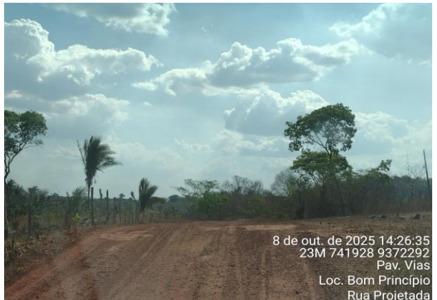
FOTO Nº 06 - RUA PROJETADA - TRECHO 3