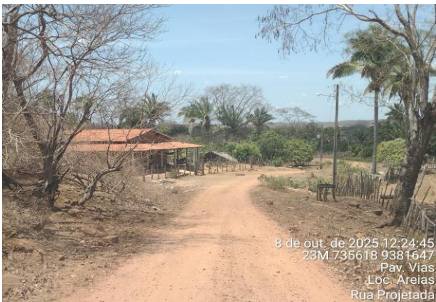
FOTO Nº 07- RUA PROJETADA