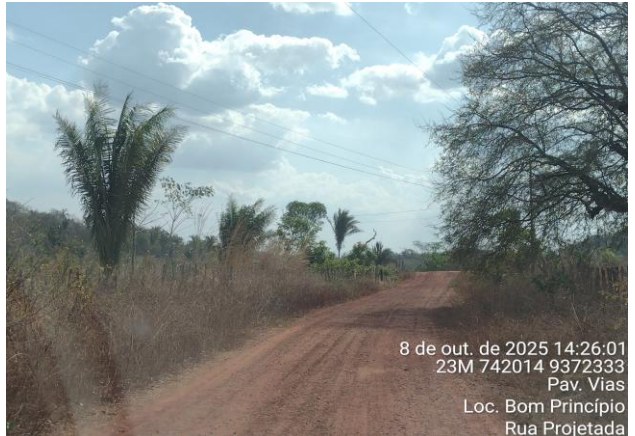
FOTO Nº 02- RUA PROJETADA - TRECHO 3