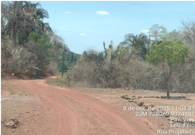
FOTO Nº 17 - RUA PROJETADA - TRECHO 1