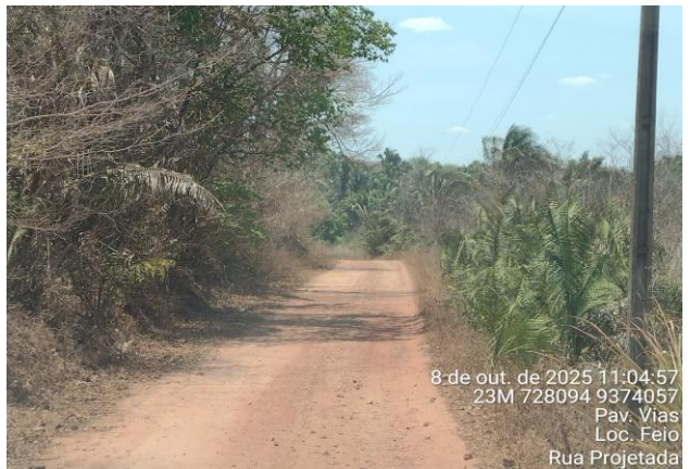
FOTO Nº 18 - RUA PROJETADA - TRECHO 1