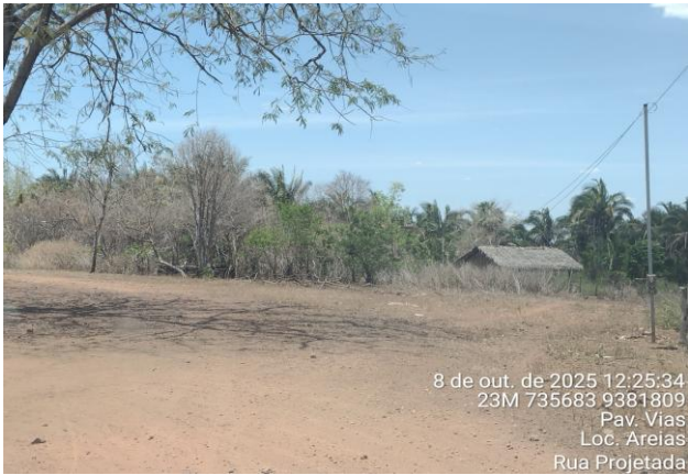
FOTO Nº 11 - RUA PROJETADA