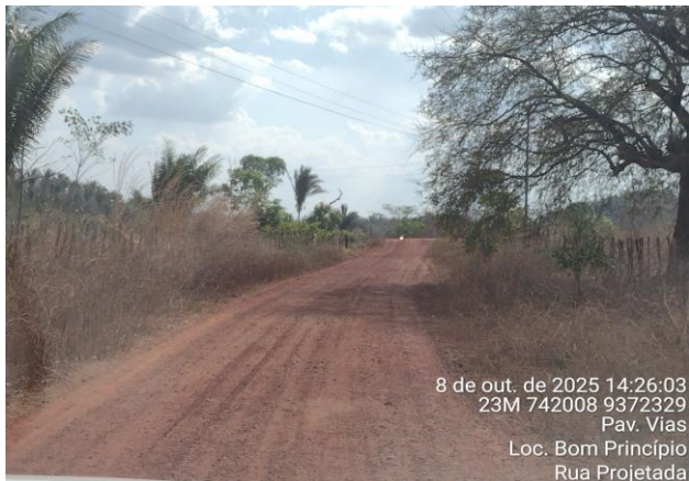
FOTO Nº 03- RUA PROJETADA - TRECHO 3