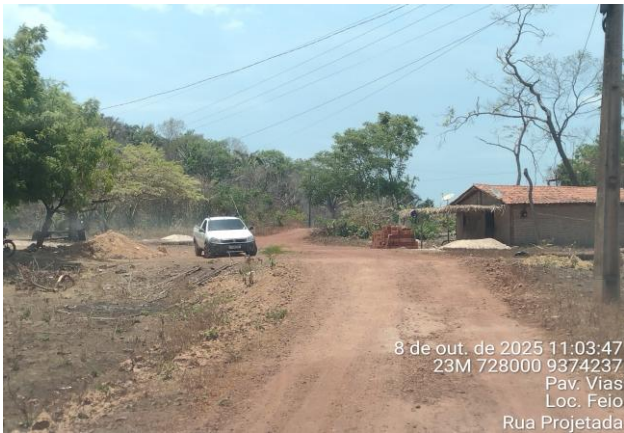
FOTO Nº 13- RUA PROJETADA - TRECHO 1