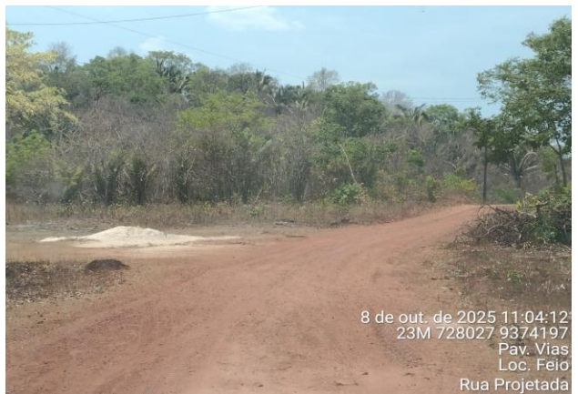
FOTO Nº 14- RUA PROJETADA - TRECHO 1