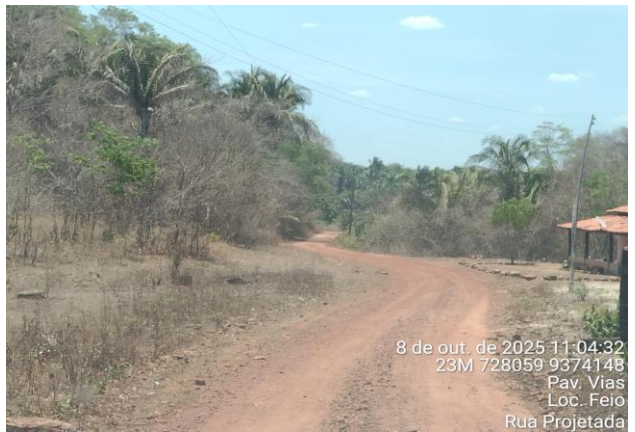
FOTO Nº 16 - RUA PROJETADA - TRECHO 1