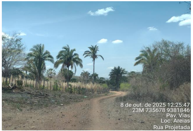
FOTO Nº 12 - RUA PROJETADA