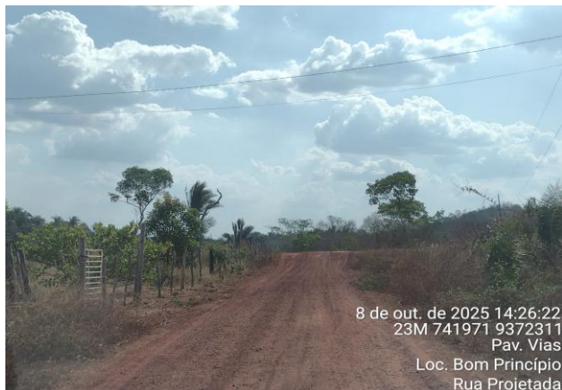
FOTO Nº 05 - RUA PROJETADA - TRECHO 3