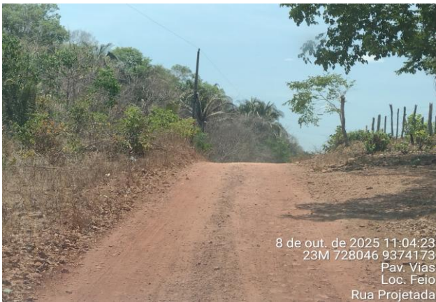
FOTO Nº 15- RUA PROJETADA - TRECHO 1