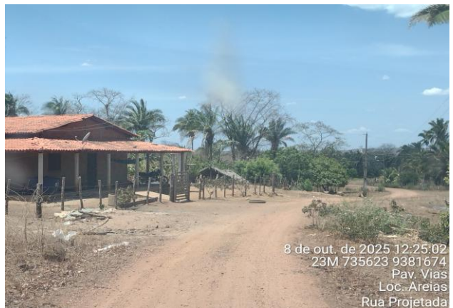
FOTO Nº 08- RUA PROJETADA