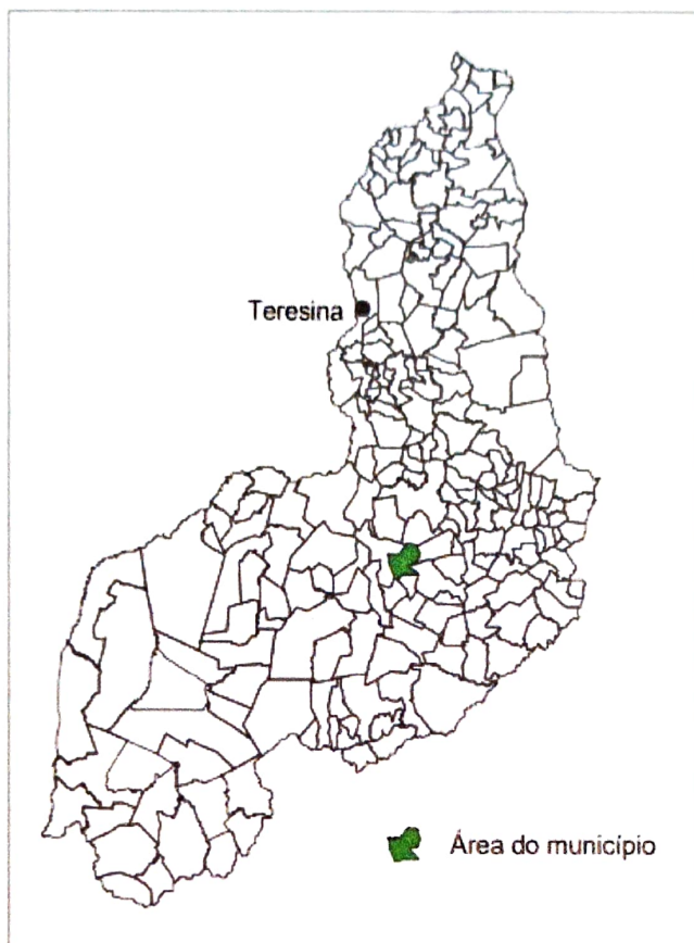
Figura 1: Localização de São Miguel do Fidalgo/PI