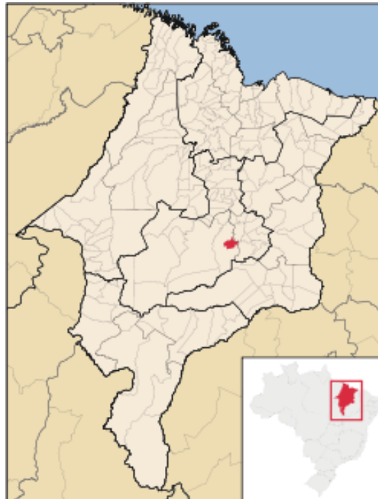
Figura 1 - Mapa de localização do município de SANTA FILOMENA - MA