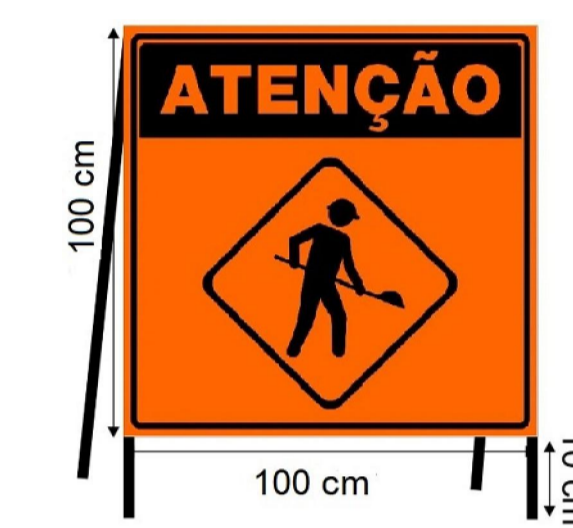
DETALHES DA SINALIZAÇÃO DE OBRA PLACA R-24 "EM OBRAS" ESCALA DIMENSÕES EM CENTÍMETROS