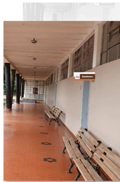
Legenda: Simulação instalação da placa interna