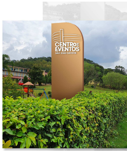
Legenda: Simulação instalação totem