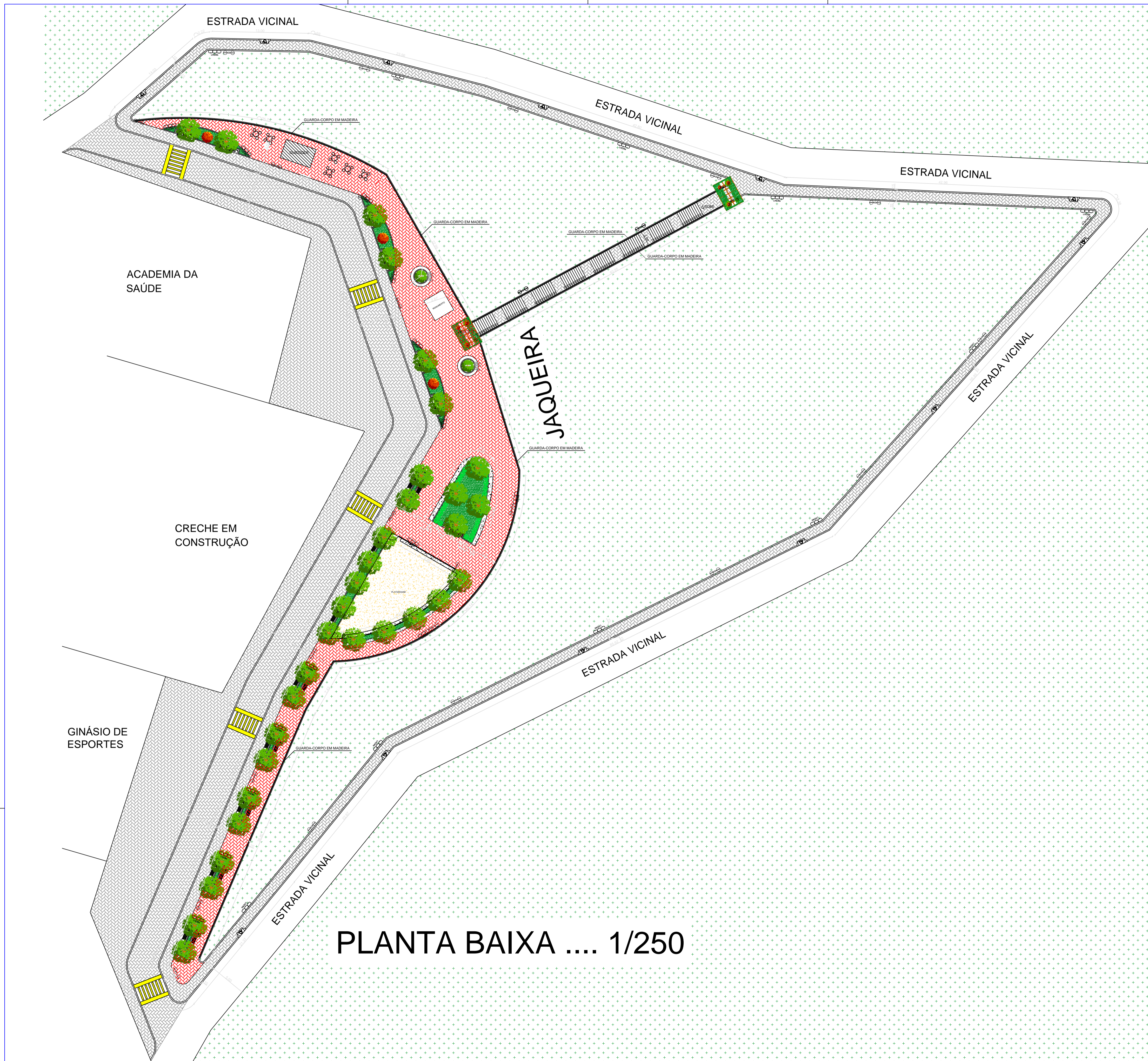
PLANTA BAIXA .... 1/250