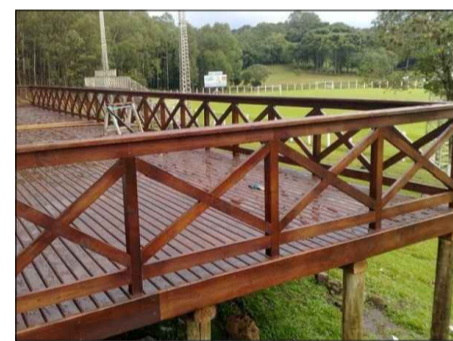
GUARDA-CORPO EM MADEIRA