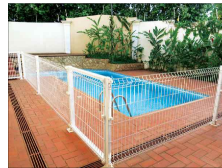
TELA NYLOFOR 3D