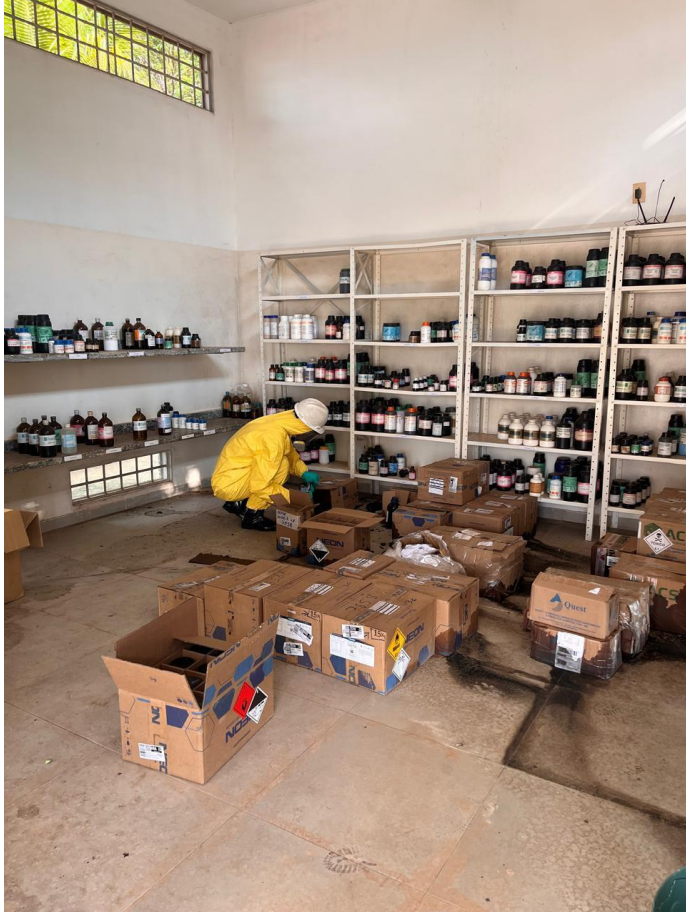
Figura 1. Condição do depósito de reagentes após o rompimento dos frascos de ácido