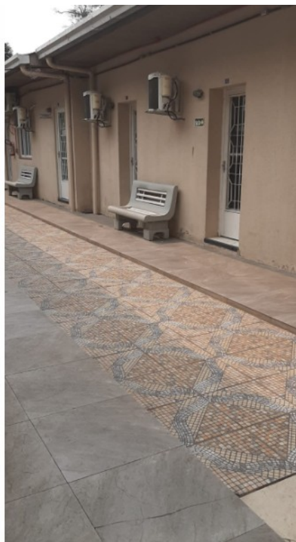
Figura 01: Área dos gabinetes dos vereadores (problemas de acessibilidade)

A reforma incluirá o nivelamento do pátio, garantindo um caminho sem obstáculos, e a substituição das portas por outras mais largas e adequadas, conforme as exigências legais de acessibilidade.