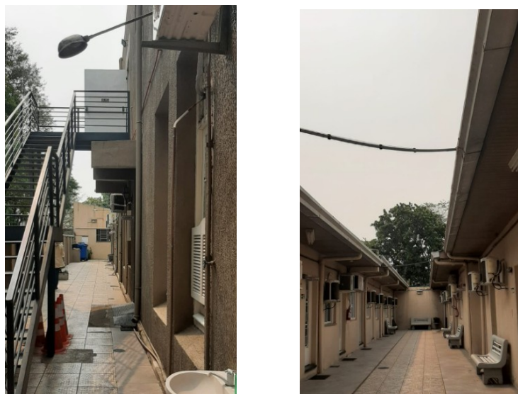
Figura 03: Pátio/corredor aberto de acesso aos gabinetes dos vereadores