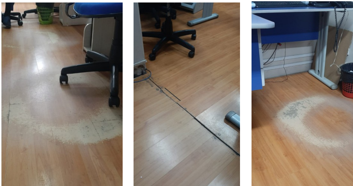
Figura 02: Desgaste do piso laminado dos departamentos

A substituição do piso laminado nos departamentos de Recursos Humanos, Contabilidade, Expediente, Controle Interno e Escola do Legislativo se faz necessária devido ao desgaste natural ocorrido ao longo do tempo, conforme evidenciado nas imagens anexas. O piso atual apresenta sinais visíveis de deterioração, como arranhões, manchas, desníveis e áreas onde o material já não se encontra devidamente fixado, comprometendo tanto a estética quanto a segurança dos ambientes.