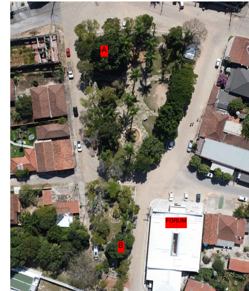
Fotografia aérea s/ esc.