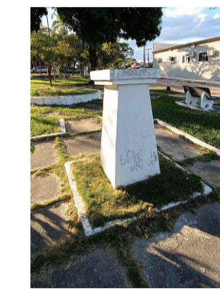
03 - Monumento de concreto