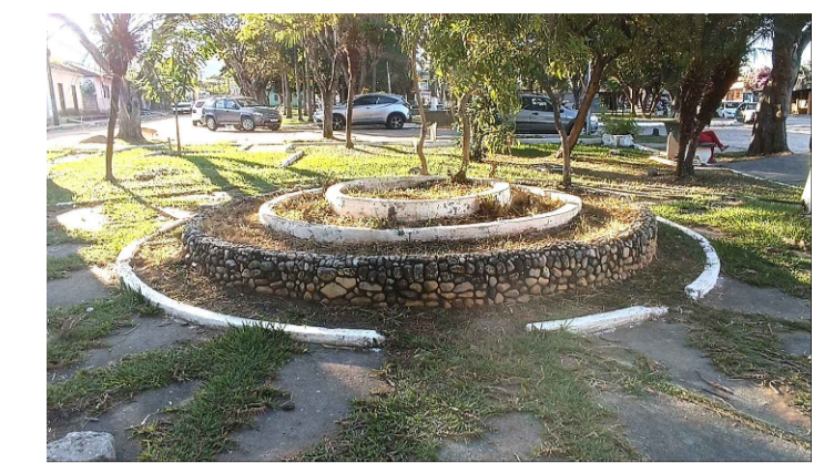
01 - Jardim elevado