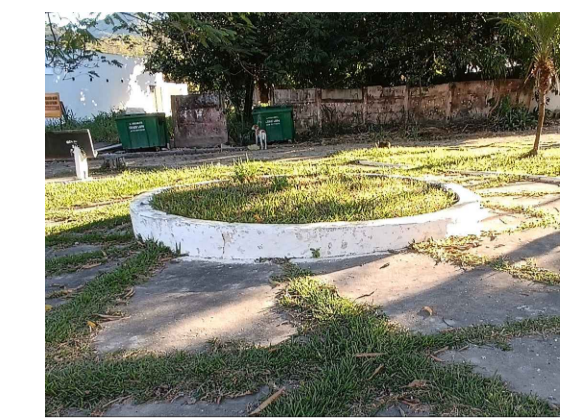
02 - Jardim elevado