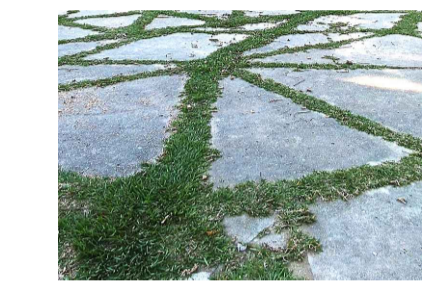
04 - Piso concreto com lastros de grama