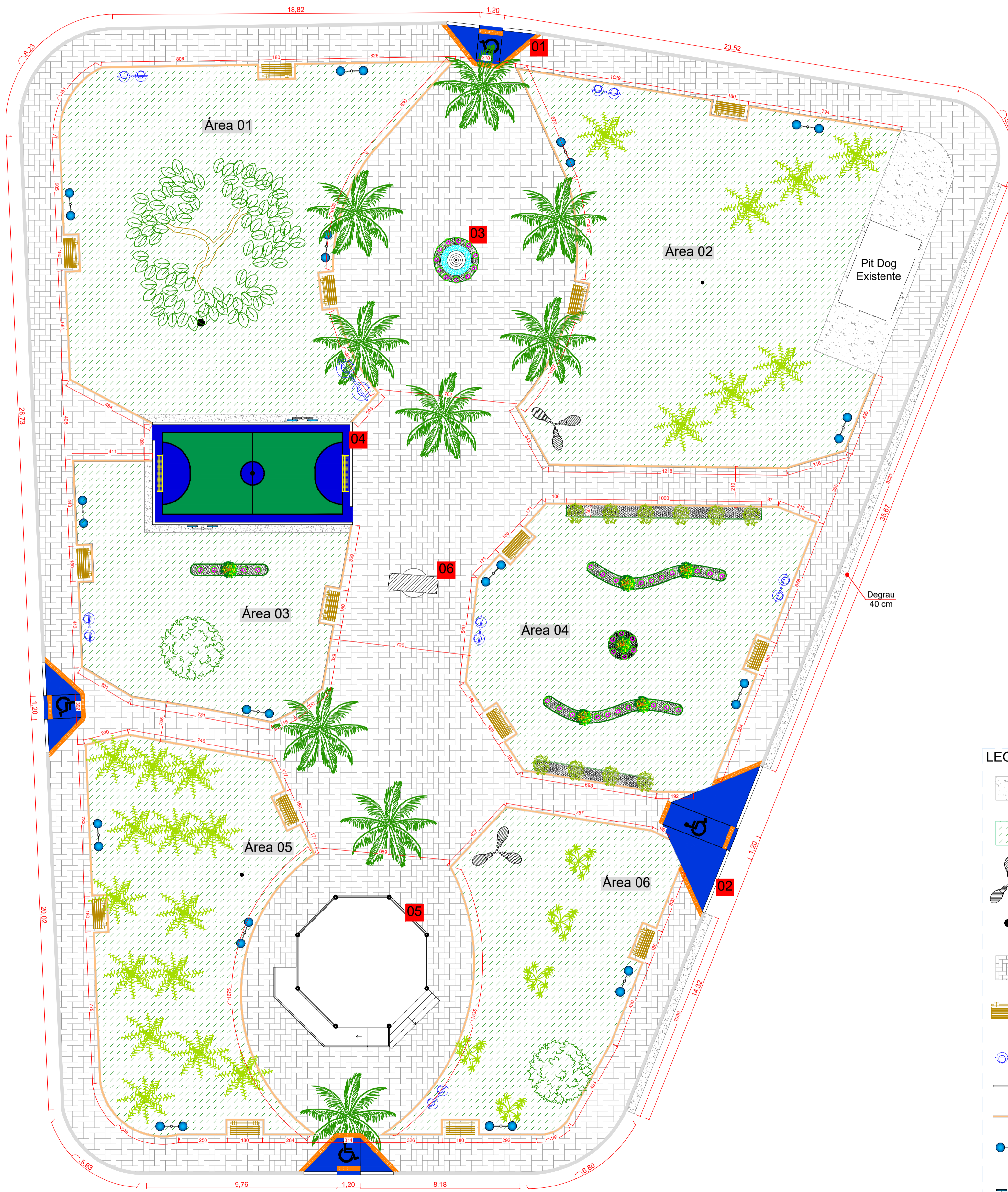
Planta revitalização - Praça A esc. 1:125

NOTA: As medidas internas para locação da praça pode haver alterações durante a execução.