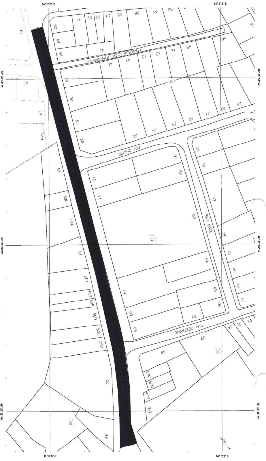
1 PLANTA DE PAVIMENTAÇÃO ESCALA: 1/1000