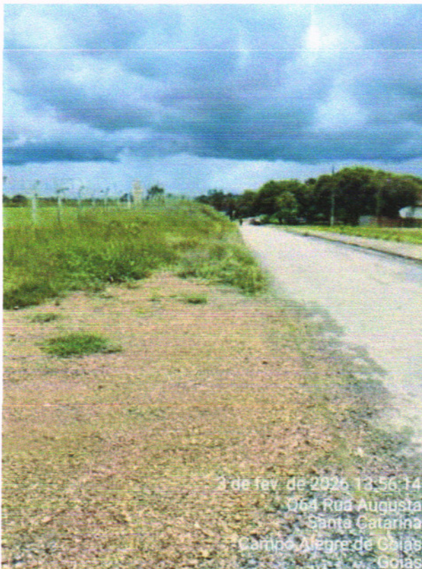
RUA AUGUSTA = 315,00 m 2