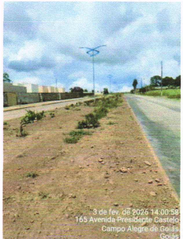
AV. CASTELO BRANCO = 814,00 m 2