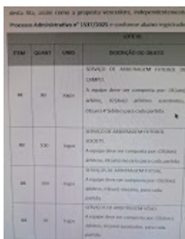
WhatsApp Image 2026-04-08 at 10.04.09.jpeg 259K