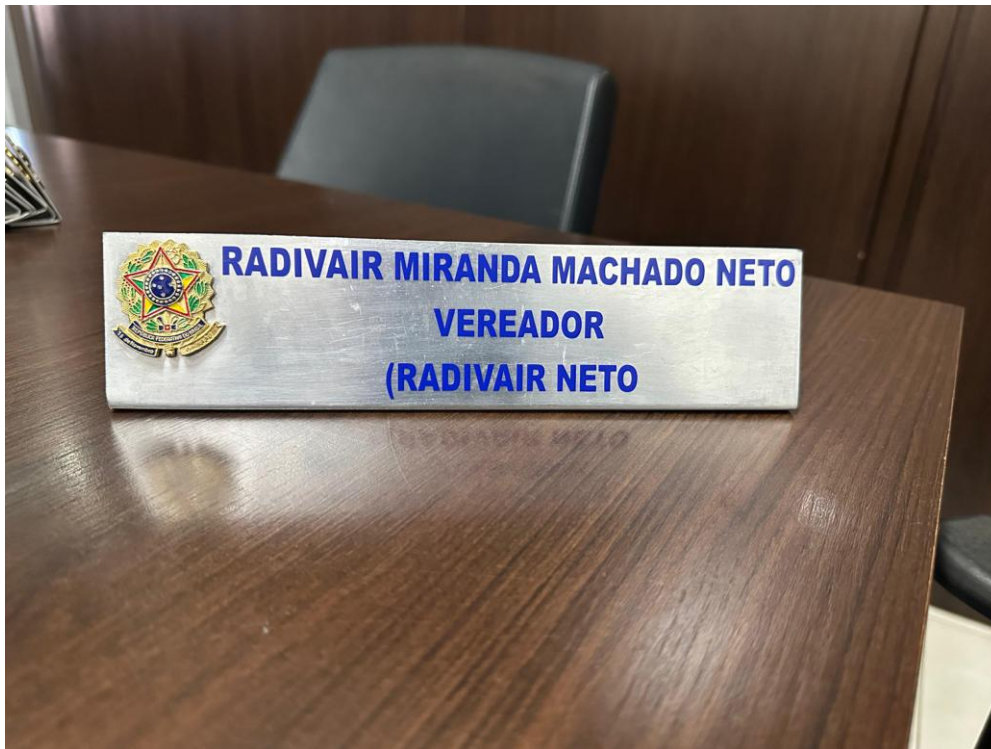
Placa Vereador – 25x6cm