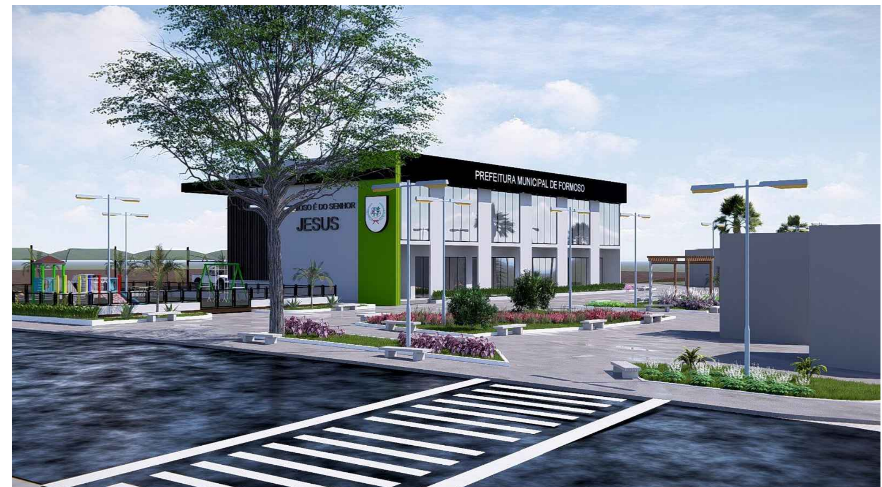
FACHADA FRONTAL LATERAL DIREITA ESC.: SEM ESCALA