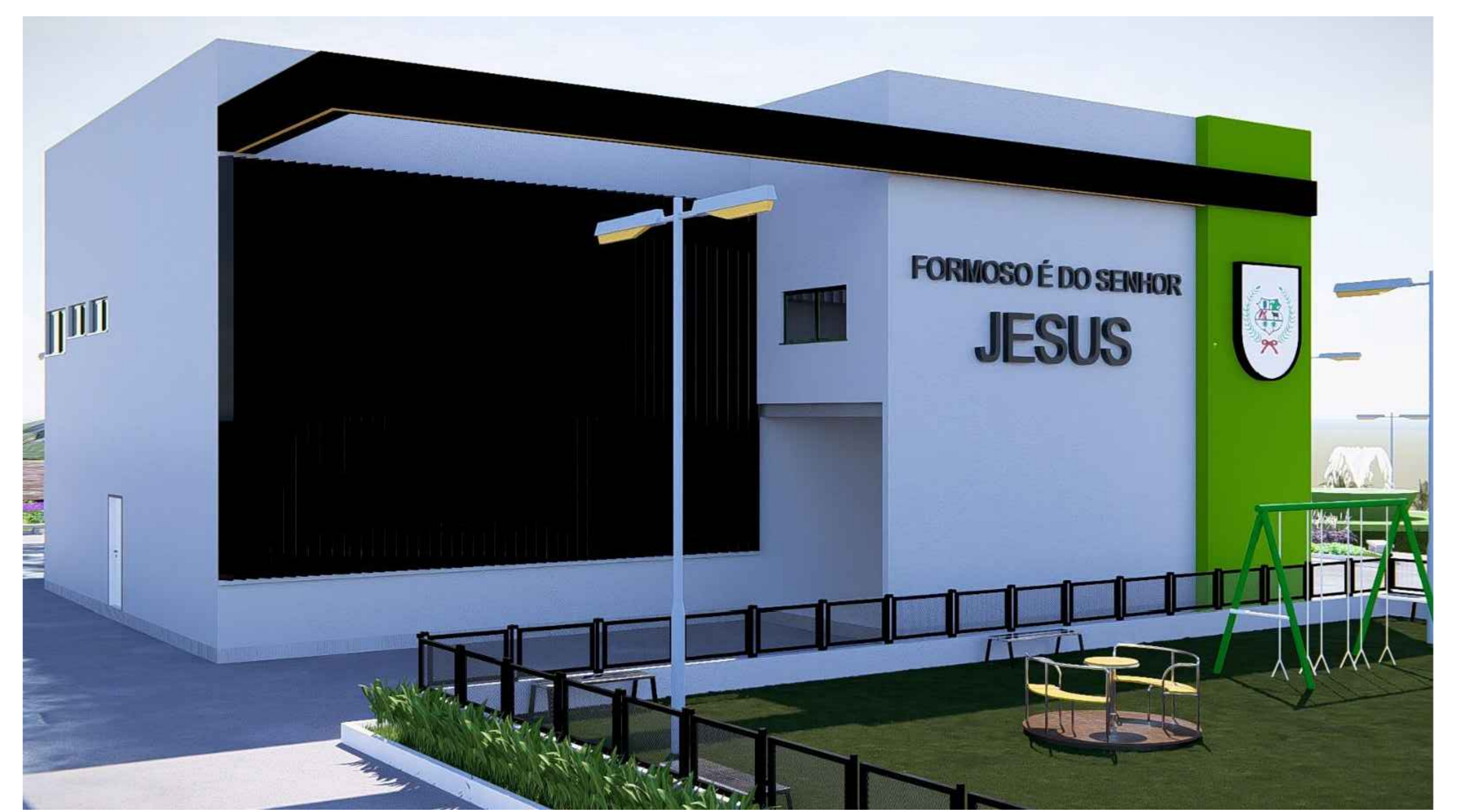
FACHADA FRONTAL ESC.: SEM ESCALA