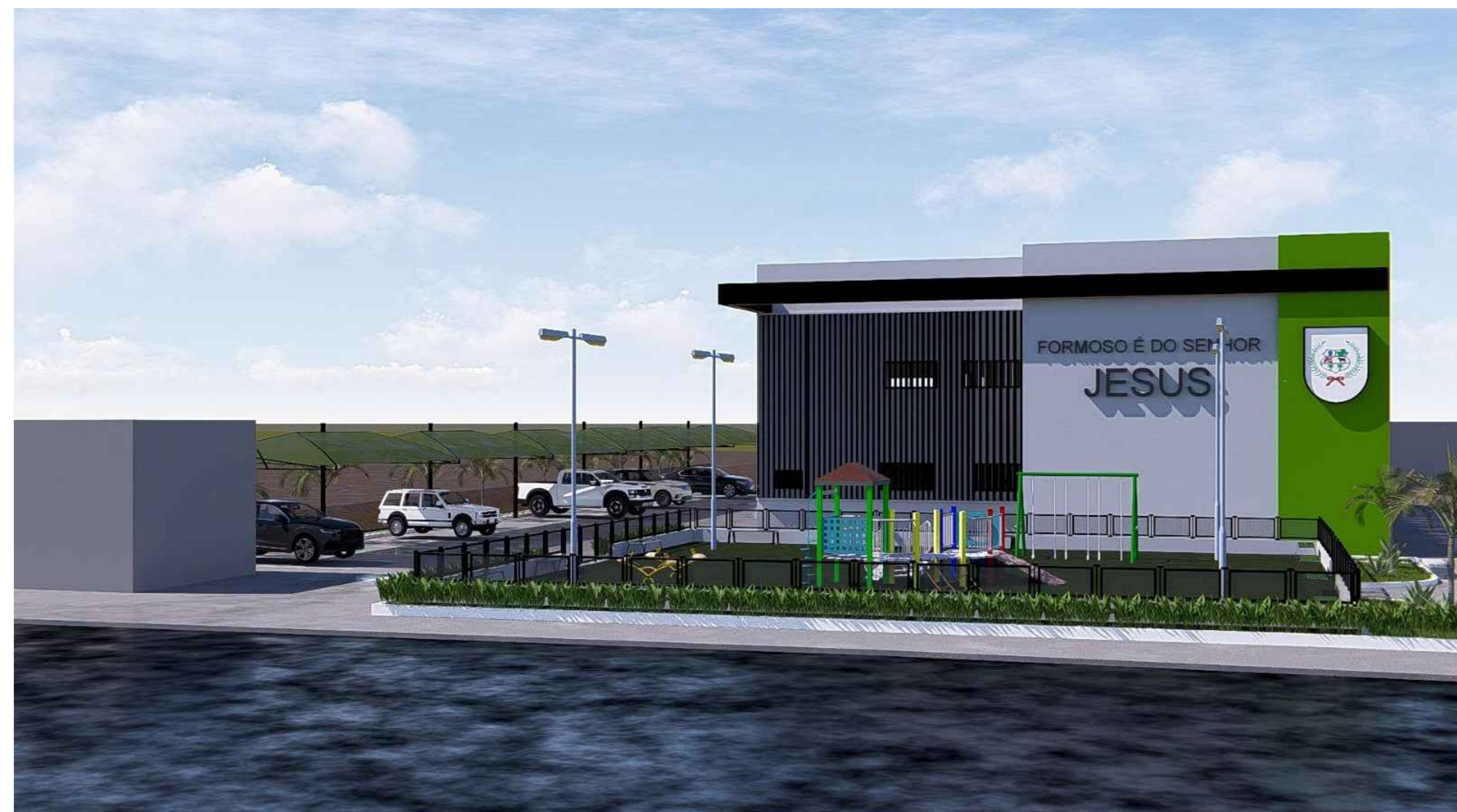
FACHADA FRONTAL ESC.: SEM ESCALA