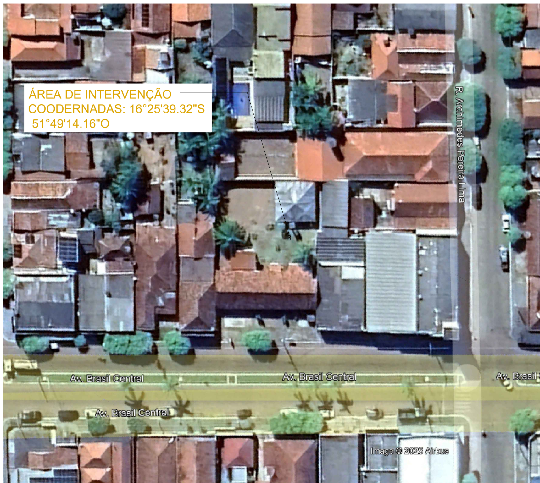
8 PLANTA SITUAÇÃO SEM ESCALA