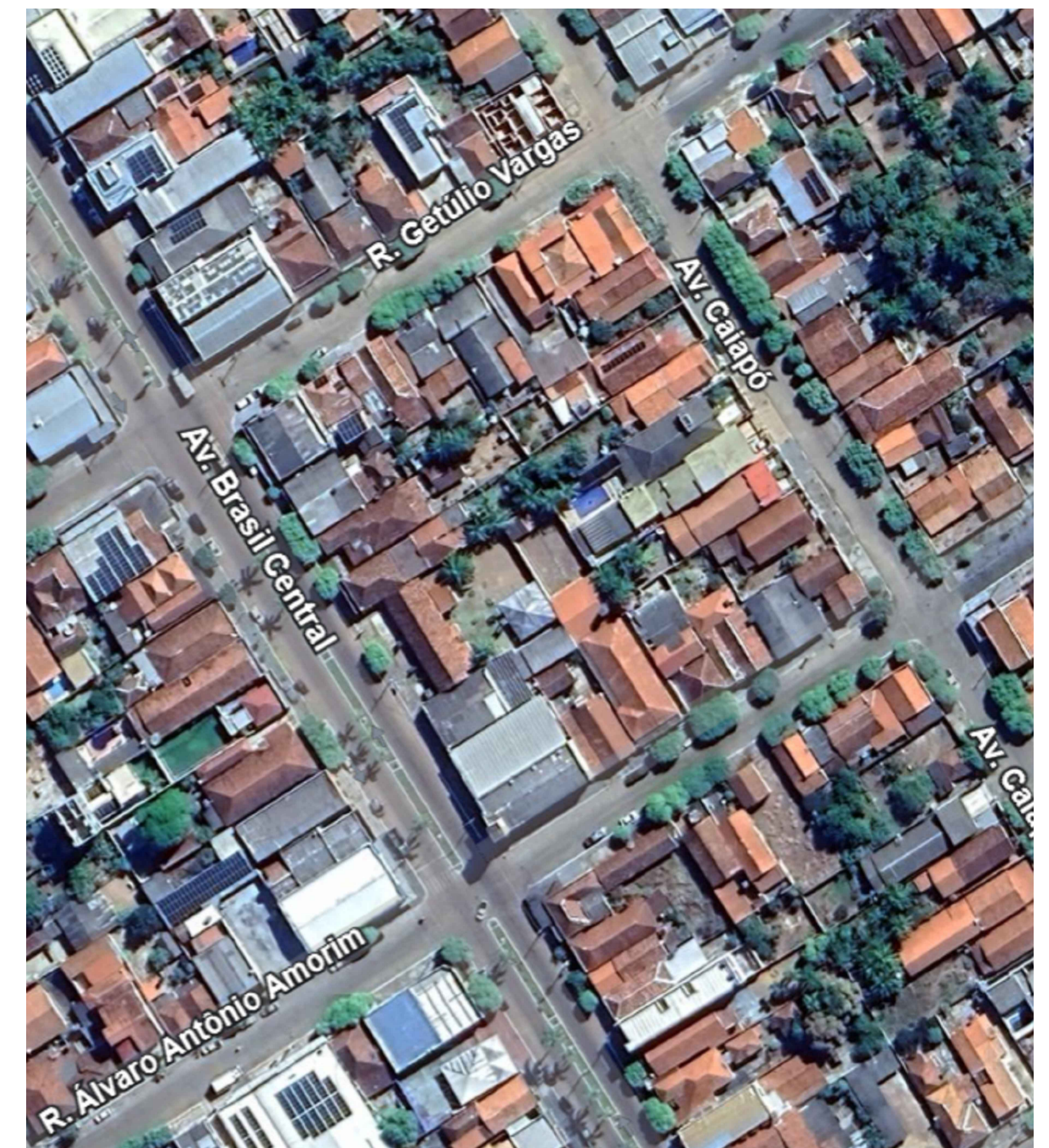
PLANTA SITUAÇÃO 1/1000