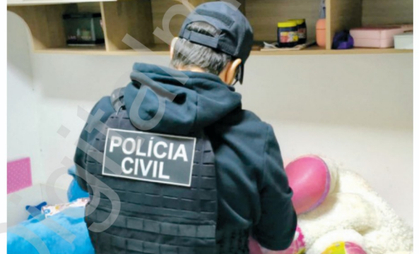
Policial civil revista uma das peças do imóvel de um dos suspeitos

Segundo Ractz Júnior, o volume de dados exige tempo e análise detalhada até que haja base suficiente para uma ação de maior impacto. “São muitas provas, é um volume muito grande de informações. Isso demanda um tempo considerável de análise para que se possa, depois de quase dois anos, deflagrar uma operação com provas