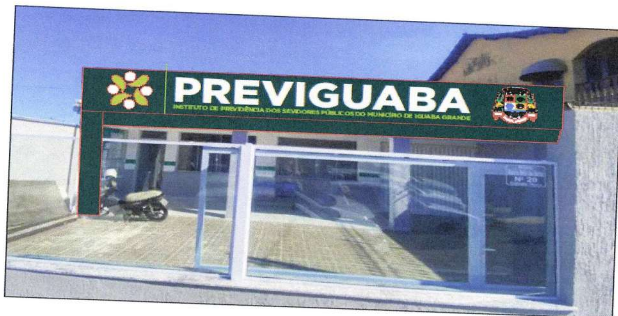
IMAGEM DO PRODUTO ALMEGADO