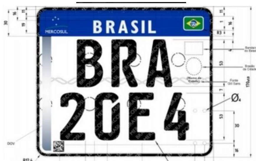
Placa padrão Mercosul para motos