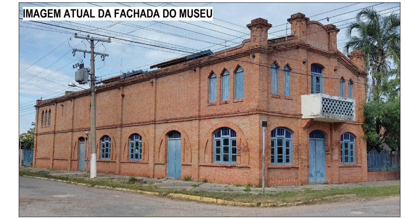
IMAGEM ATUAL DA FACHADA DO MUSEU