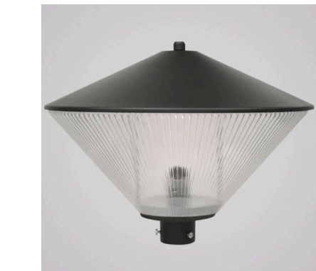
LUMINÁRIA SBD-207 SHOMEI 5 UNIDADES

NOTAS GERAIS: 1. ANTES DO INÍCIO DA OBRA, CONFERIR MEDIDAS E NÍVEIS NO LOCAL PARA A CONFIRMAÇÃO DE COMPATIBILIDADE ENTRE PROJETOS E LOCAÇÕES GERAIS 2. A EXECUÇÃO E REALIZAÇÃO DE INTERVENÇÕES DISTINTAS, BEM COMO USO DE MATERIAIS DIFERENTES DO ESPECIFICADOS EM PROJETO SÃO DE INTEIRA RESPONSABILIDADE DO EXECUTOR. 3. ALTERAÇÃO NESTE PROJETO SOMENTE COM AUTORIZAÇÃO EXPRESSA DO RESPONSÁVEL DO PROJETO. 4. MEDIDAS E DIMENSÕES EM METROS, EXCETO QUANDO INDICADO. 5. A INOBSERVÂNCIA DO PROJETO, BEM COMO DE SUAS NOTAS GERAIS, EXIME O AUTOR DO PROJETO DE QUALQUER RESPONSABILIDADE TÉCNICA SOBRE O PROJETO.