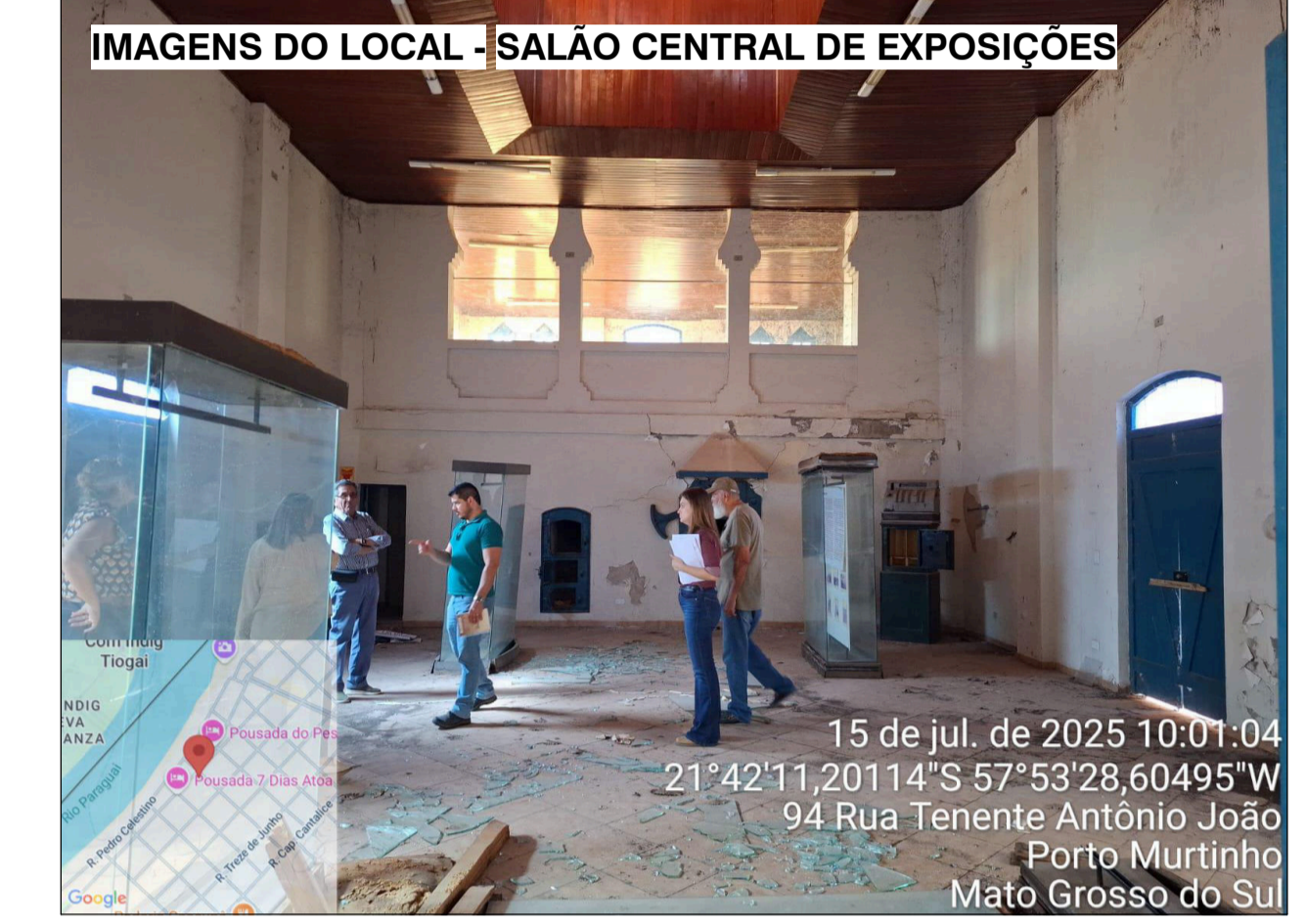
IMAGENS DO LOCAL - SALÃO CENTRAL DE EXPOSIÇÕES

NOTAS GERAIS: 1. ANTES DO INÍCIO DA OBRA, CONFERIR MEDIDAS E NÍVEIS NO LOCAL PARA A CONFIRMAÇÃO DE COMPATIBILIDADE ENTRE PROJETOS E LOCAÇÕES GERAIS 2. A EXECUÇÃO E REALIZAÇÃO DE INTERVENÇÕES DISTINTAS, BEM COMO USO DE MATERIAIS DIFERENTES DO ESPECIFICADOS EM PROJETO SÃO DE INTEIRA RESPONSABILIDADE DO EXECUTOR. 3. ALTERAÇÃO NESTE PROJETO SOMENTE COM AUTORIZAÇÃO EXPRESSA DO RESPONSÁVEL DO PROJETO. 4. MEDIDAS E DIMENSÕES EM METROS, EXCETO QUANDO INDICADO. 5. A INOBSERVÂNCIA DO PROJETO, BEM COMO DE SUAS NOTAS GERAIS, EXIME O AUTOR DO PROJETO DE QUALQUER RESPONSABILIDADE TÉCNICA SOBRE O PROJETO.