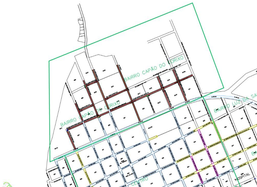
Imagem 01: Recorte do Projeto Geométrico

A obra em questão está localizada em trechos das vias do Bairro Capão do Corixo, no município de Vila Bela da Santíssima Trindade-MT.