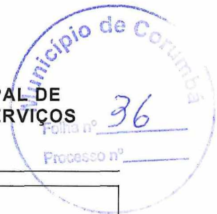
Guilherme de Souza Fogaça Engenheiro Civil Matrícula 14080