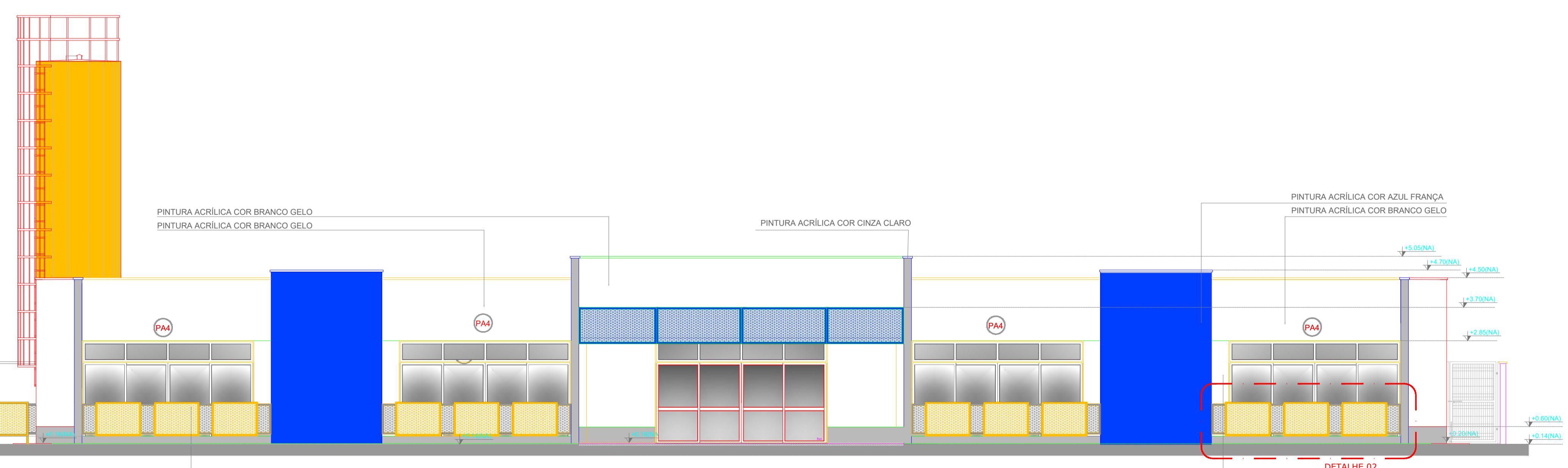
FACHADA 05 ESC: 1/75