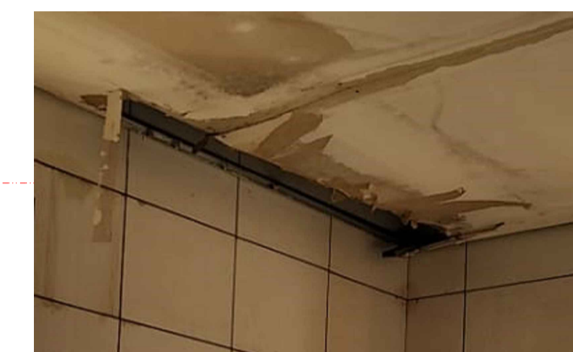
FORRO PARCIALMENTE DANIFICADO