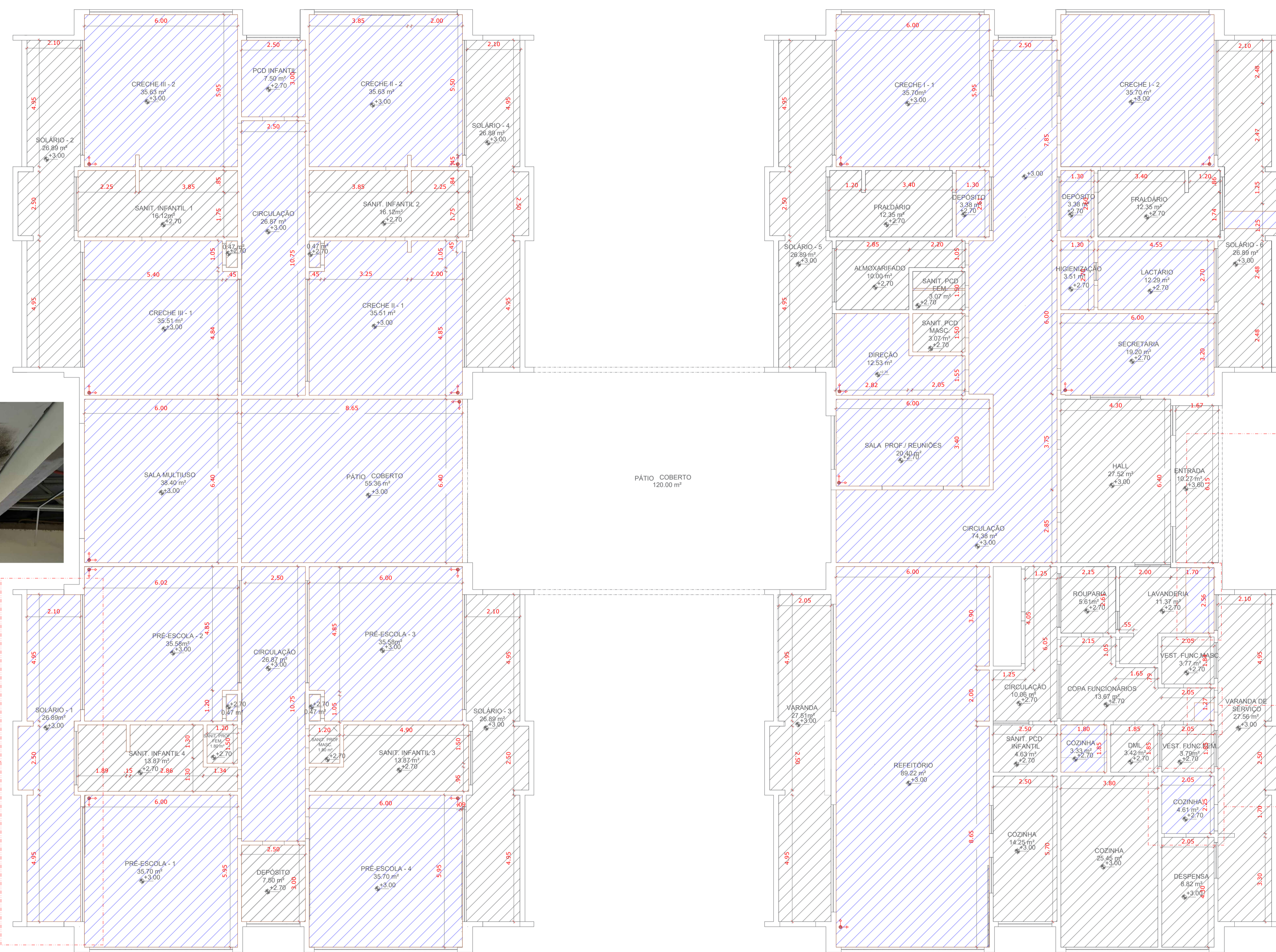
PLANTA DE TETO ESC: 1/100