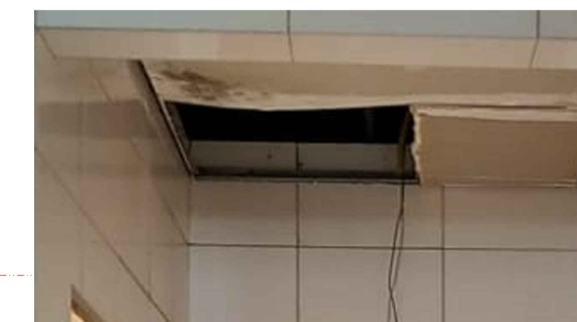
FORRO PARCIALMENTE DANIFICADO