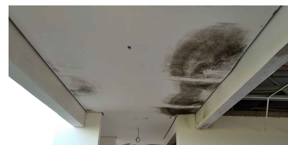
FORRO COM INFILTRAÇÃO