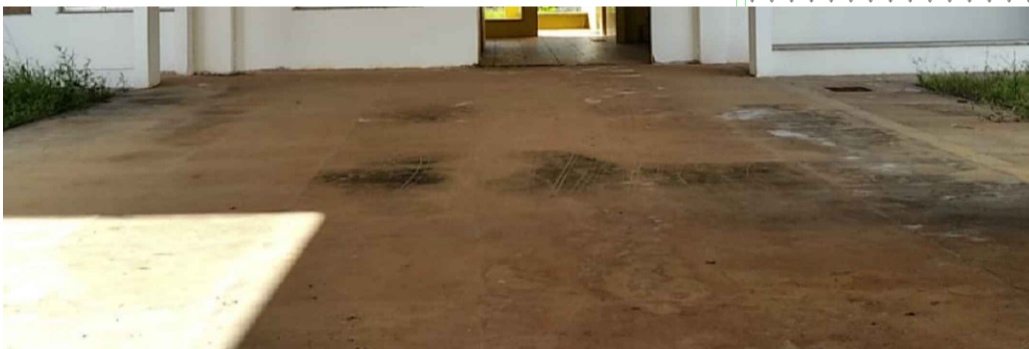
PISO CIMENTADO CONFORME PRANCHA PSE - 09