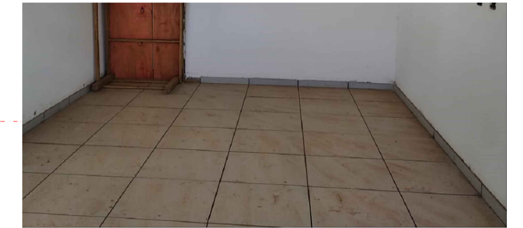
PISO DE CERÂMICA CONFORME PRANCHA PSE - 09