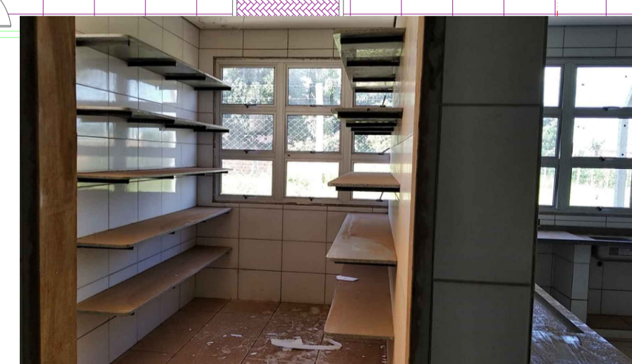
PRATELEIRAS DE GRANITO CINZA CONFORME PRANCHA PSE - 07