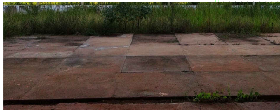
PISO DE CONCRETO CONFORME PRANCHA PSE-09