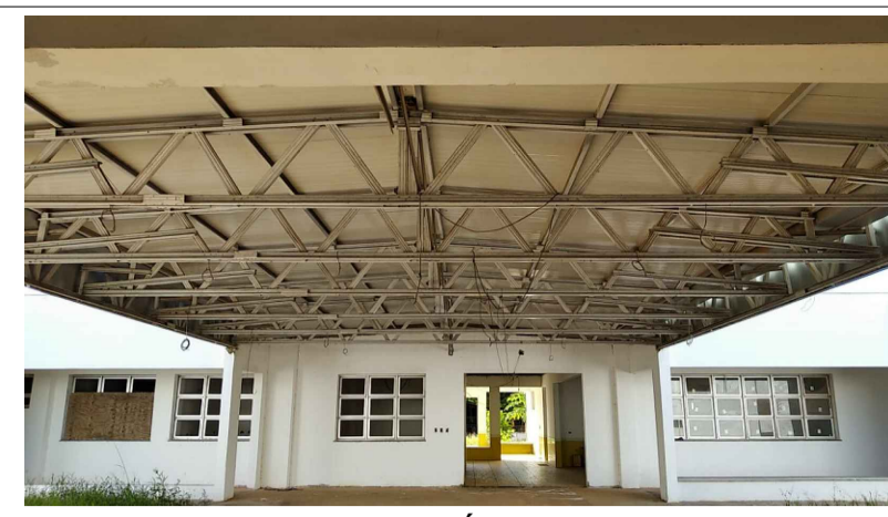
COBERTURA COM TELHA METÁLICA TERMO ACÚSTICA