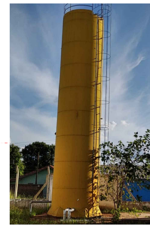
CAIXA D'ÁGUA DE 30.00L CONFORME PADRÃO