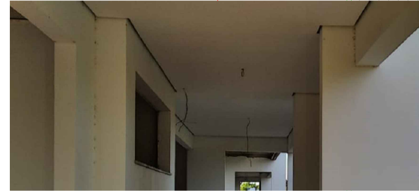
FORRO DE GESSO MINERAL EXECUTADO CONFORME PRANCHA PFR-06