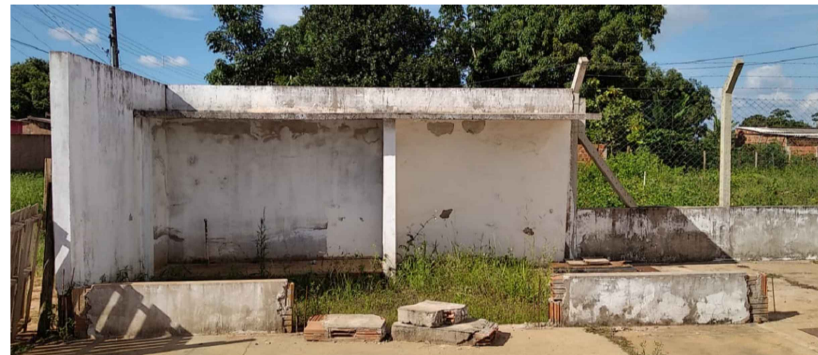
CASA DE GÁS PARCIALMENTE DANIFICADA