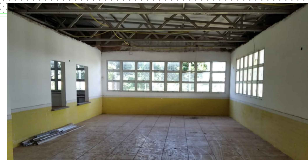
JANELAS INSTALADAS CONFORME PRANCHA PSE - 07