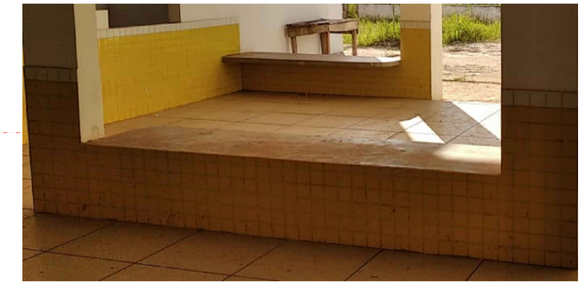
BANCOS EM ALVENARIA E ASSENTADO EM CONCRETO PRÉ-MOLDADO CONFORME PRANCHA PSE - 09