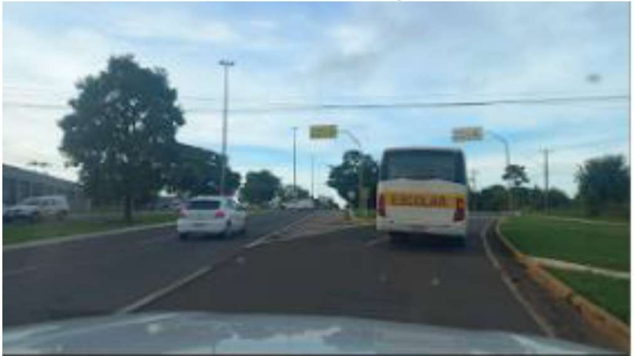
ACESSO A DIREITA