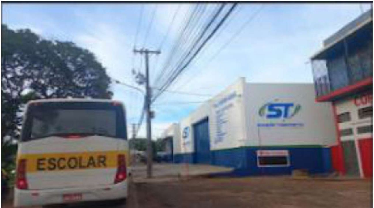
PONTO 03 - EM FRENTE A EMPRESA ST SOLUÇÃO TRANSPORTES