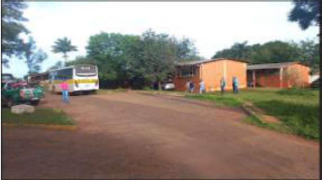
FINAL - E.M. AGRÍCOLA GOV. ARNALDO ESTEVÃO DE FIGUEIREDO