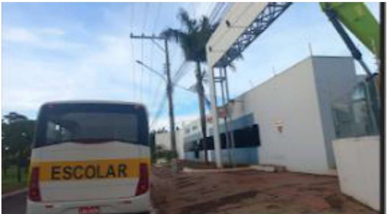
PONTO 02 - EM FRENTE A EMPRESA DYNAPAC