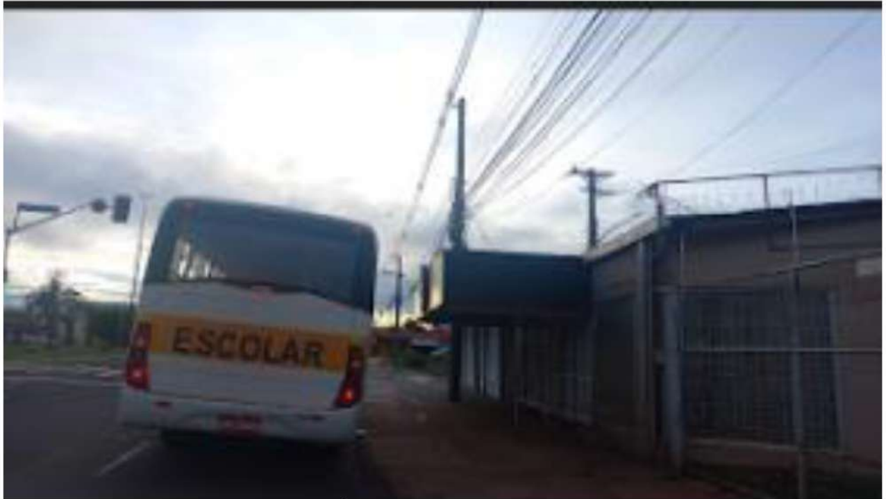
INÍCIO DA LINHA - PONTO 01