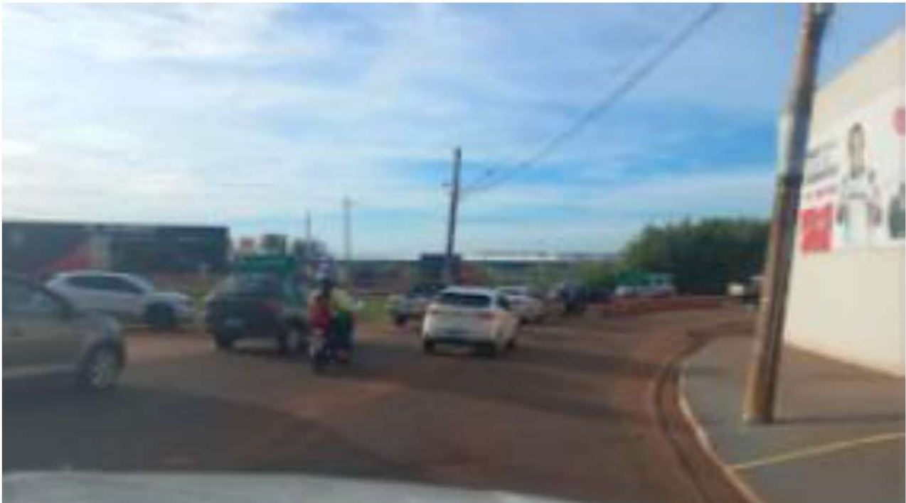
CONVERSÃO A DIREITA - ANEL RODOVIÁRIO