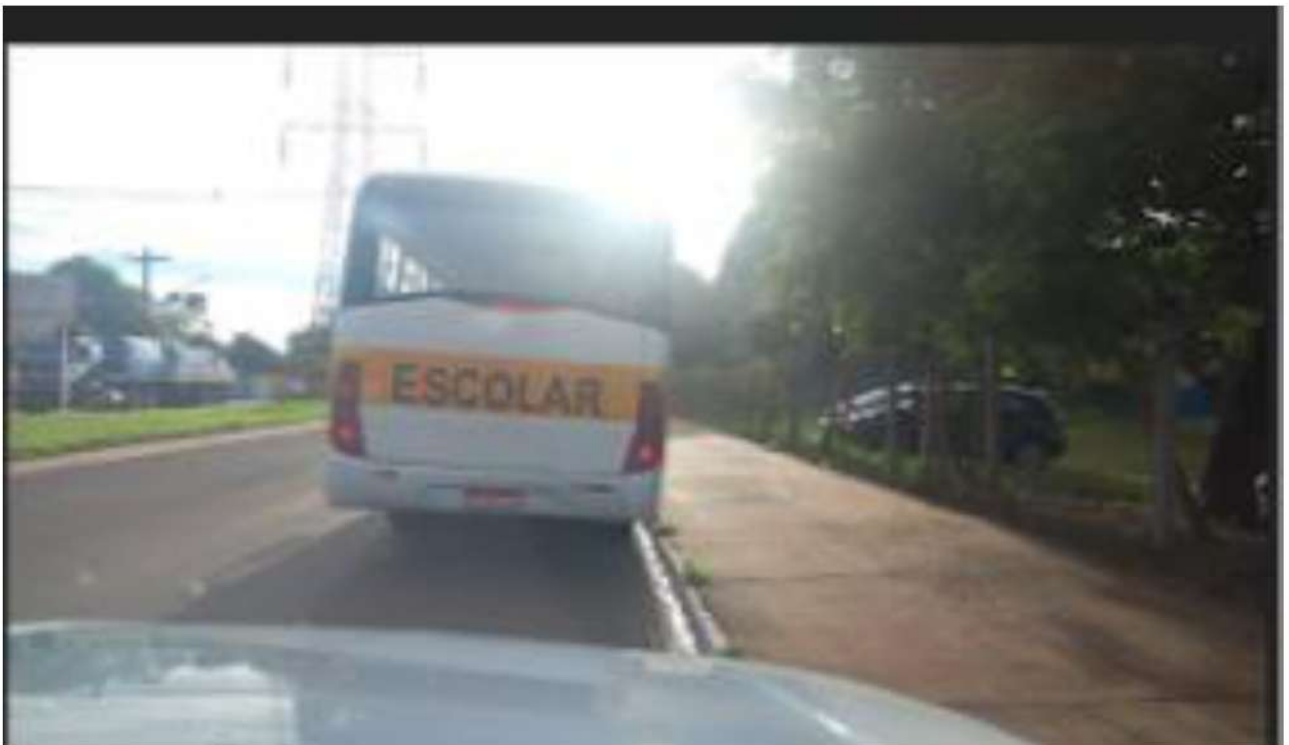
PONTO 04 - EMEI LUIZ CARLOS SOBRAL PETTENGIL