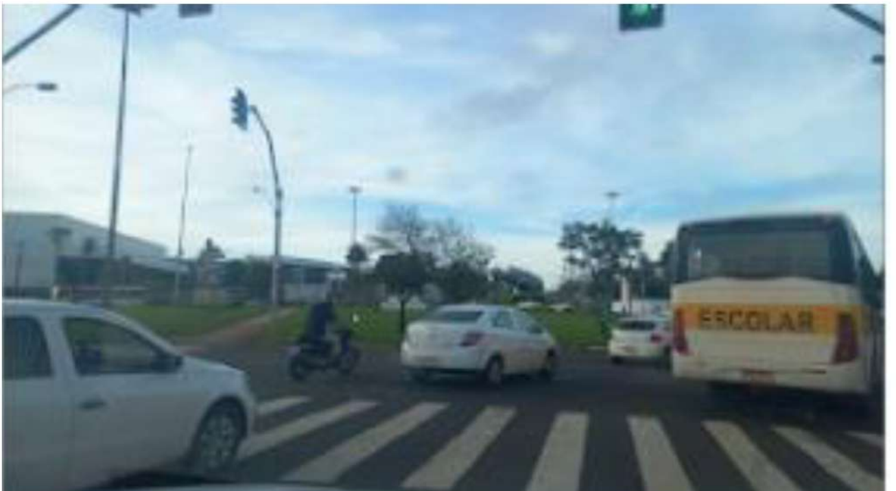
ROTATÓRIA - 2º SAÍDA