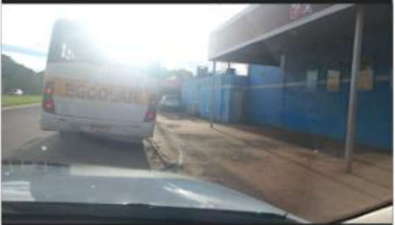
PONTO 05 - MERCADO RIO SUL