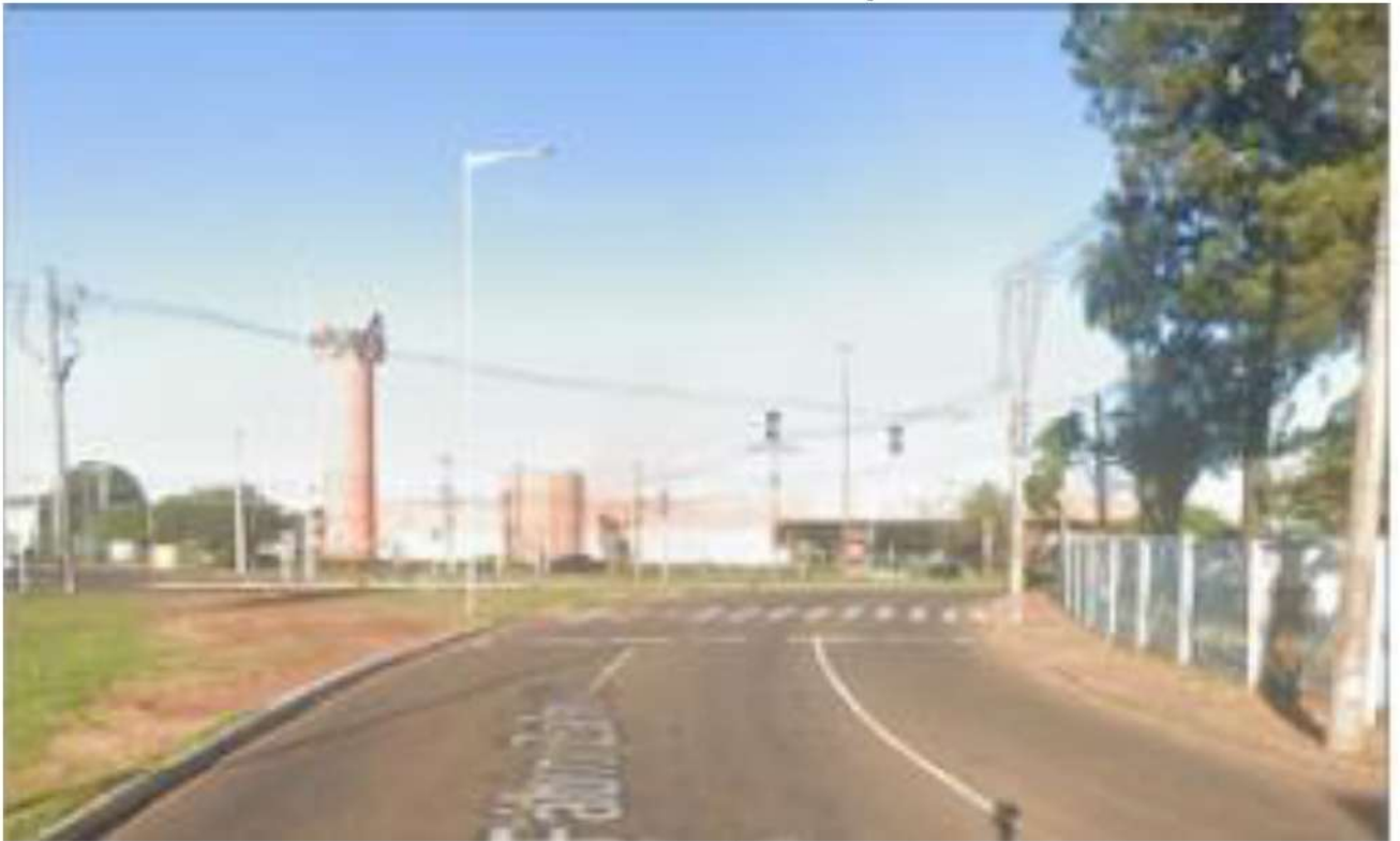
CONVERSÃO A DIREITA