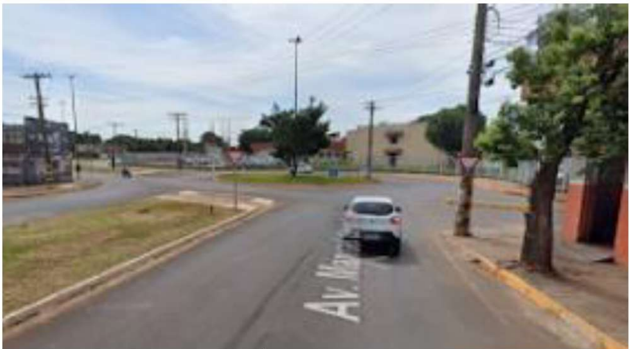
ROTATÓRIA A ESQUERDA