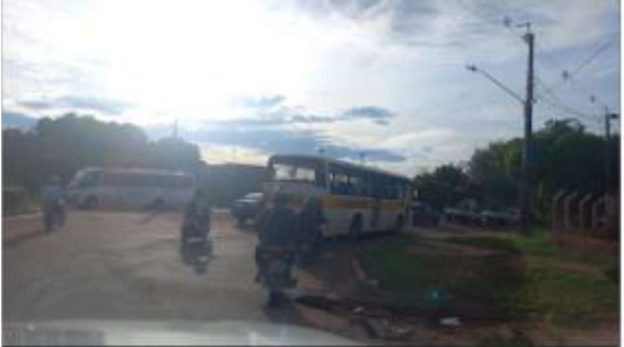
CONVERSÃO A DIREITA