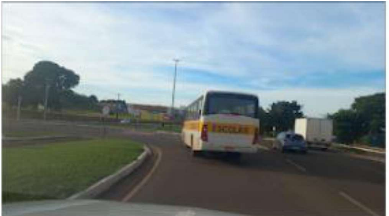
RETORNO - AV. GURY MARQUES