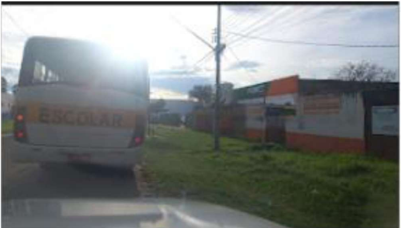
PONTO 06 - ABC OXIGÊNIO