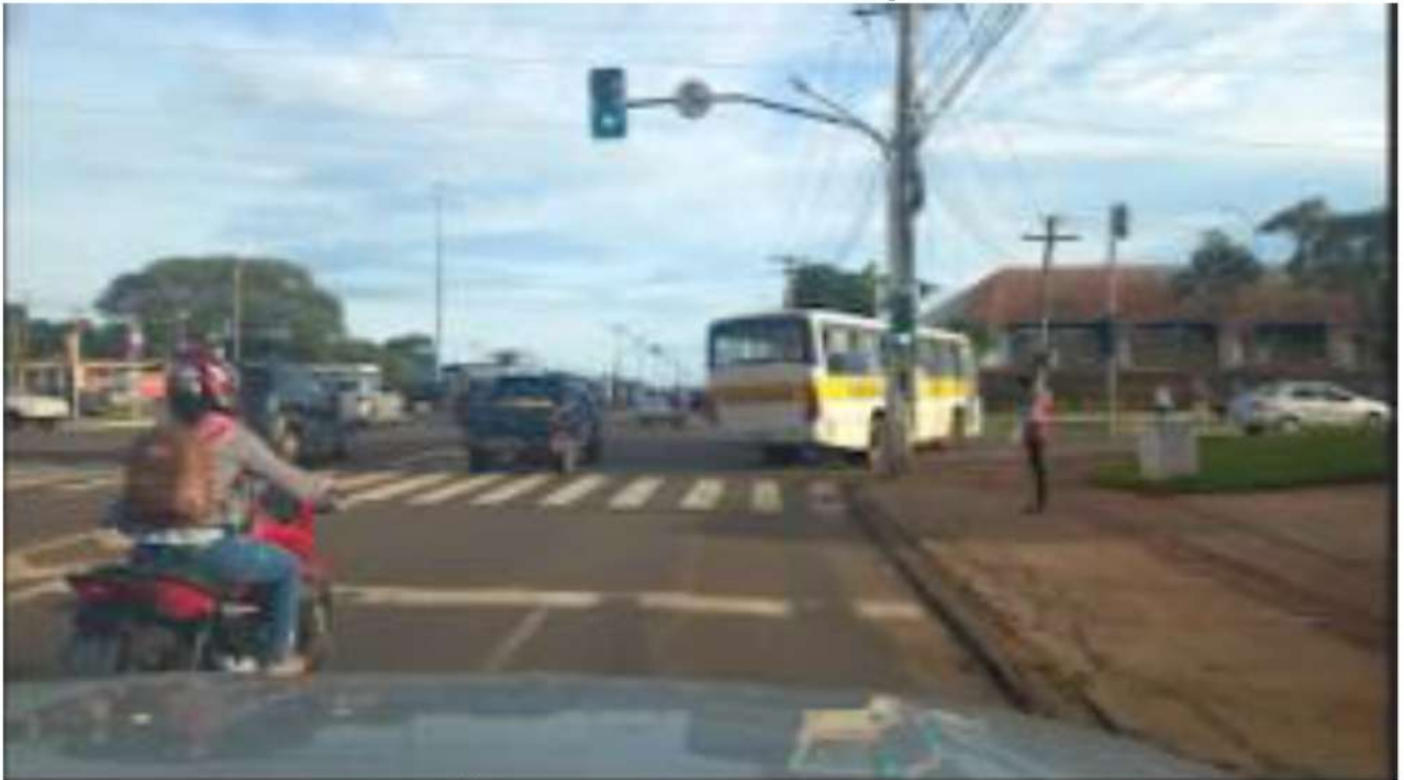
CONVERSÃO A DIREITA - ACESSO AV. GUAICURUS