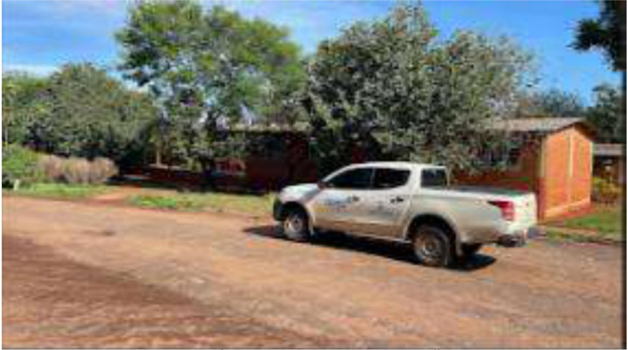
FINAL - E.M. AGRÍCOLA GOV. ARNALDO ESTEVÃO DE FIGUEIREDO