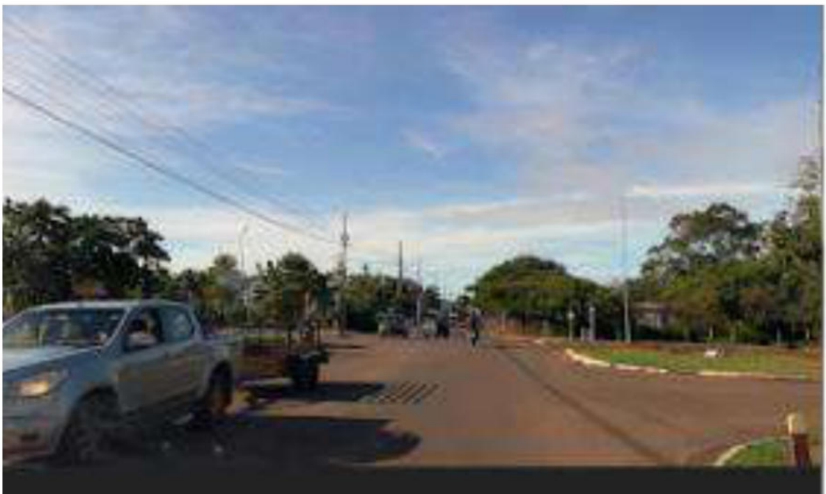
CONVERSÃO A ESQUERDA