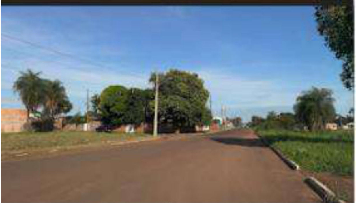
CONVERSÃO A ESQUERDA