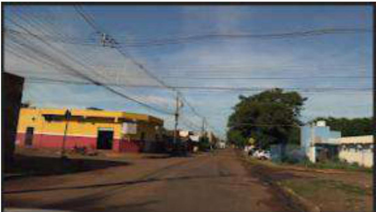
PONTO 03- CONVERSÃO A ESQUERDA- PADARIA