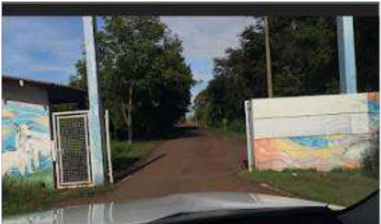
ACESSO À ESCOLA A DIREITA