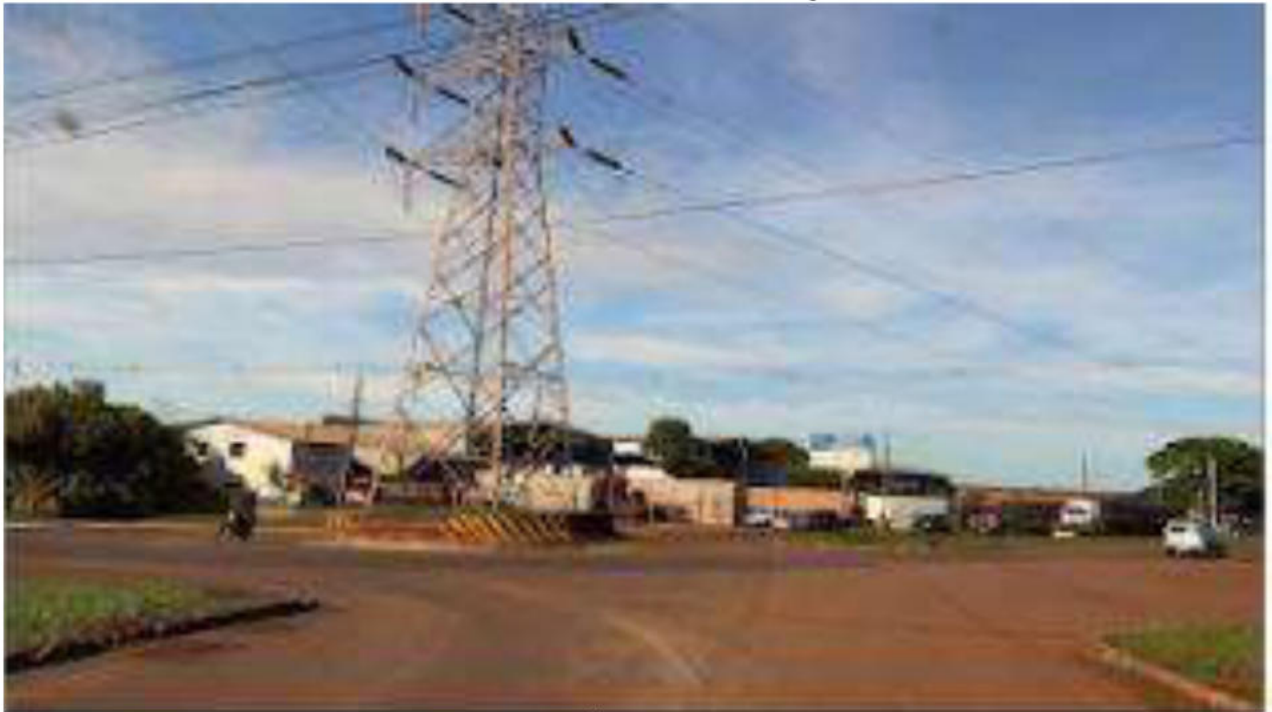
CONVERSÃO A ESQUERDA