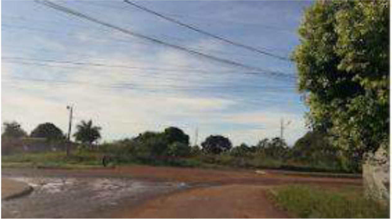
CONVERSÃO A DIREITA