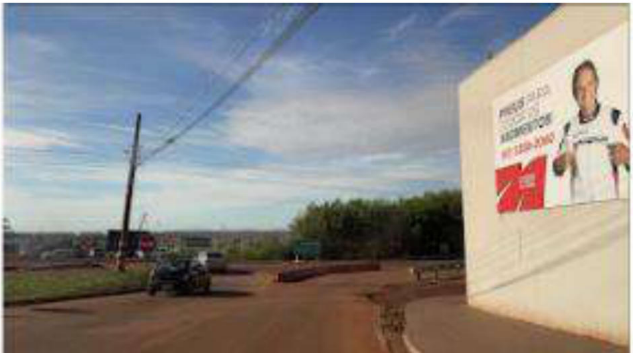
CONVERSÃO A DIREITA