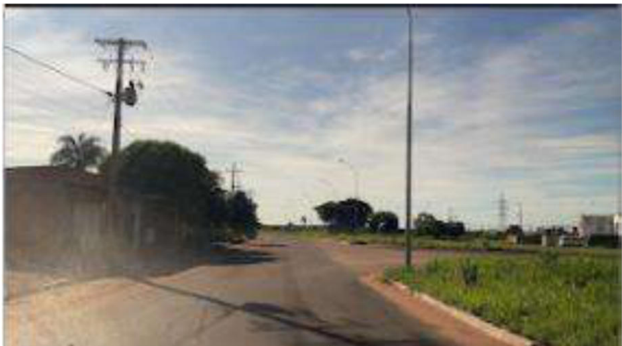
CONVERSÃO A DIREITA