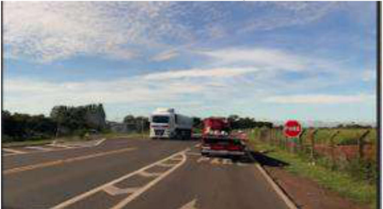
ACESSO A 040- CONVERSÃO A ESQUERDA