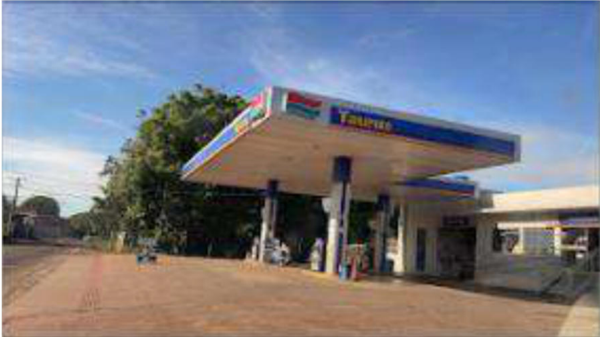
INÍCIO - POSTO TAURUS